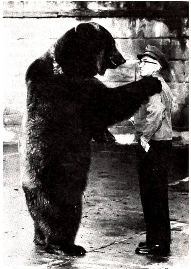
Abschied vom alten Bärenwärter

«Bevor ich jedoch die Summe anweisen lasse, sind noch ein paar Formalitäten zu erledigen.