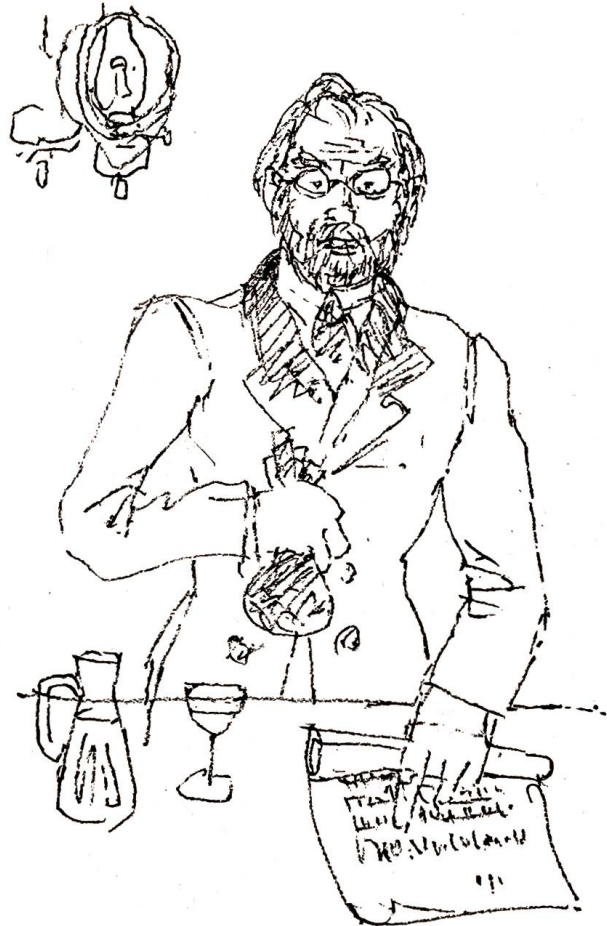
Der Stadtarzt klopfte den Beutel auf den Tisch und entrollte das Pergament.

Unter dem Stadttor stiess ihn einer unwirsch zur Seite, genau gegen die Brust, dass die Rippen