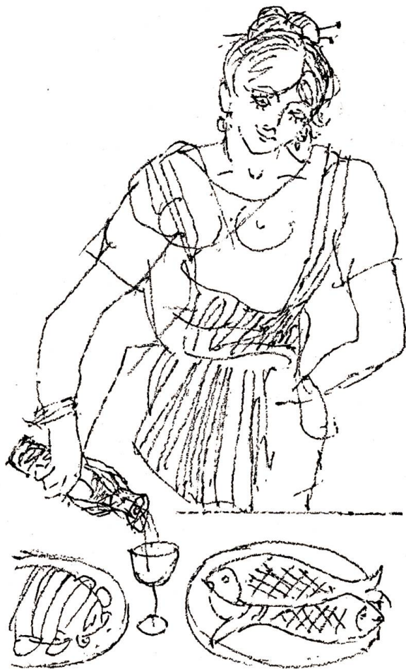
Das alles hatte die Wirtin zu richten befohlen. «Schmeckt's? Noch einen Krug Wein?»

«Wahrhaftig? Totenerweckung in aller Öffentlichkeit? Das muss ich gleich meinem Mann und der ganzen Stadt berichten. Trinkt nur, bestellt, wie's Euch beliebt!» Und fort war sie, zuerst im Haus und dann in den paar Gassen der Stadt. Zu der Frau des Kaminfegers lief sie