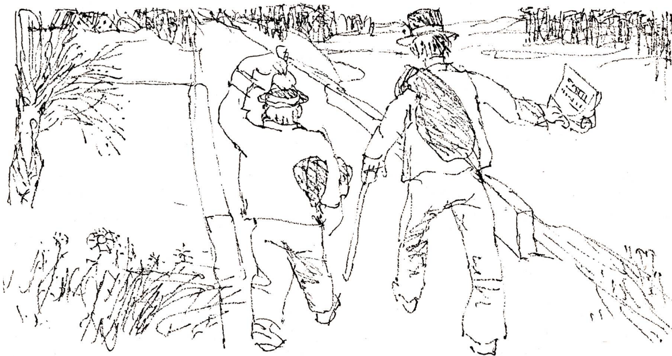
Sie winkten Abschied, der Grosse schwenkte das Diplom, der Kleine hob den Beutel bis über den Kopf.

In der Wirtin Augen sammelten sich zwei perl-grosse Tränen, die langsam bis zu den Mundwin-