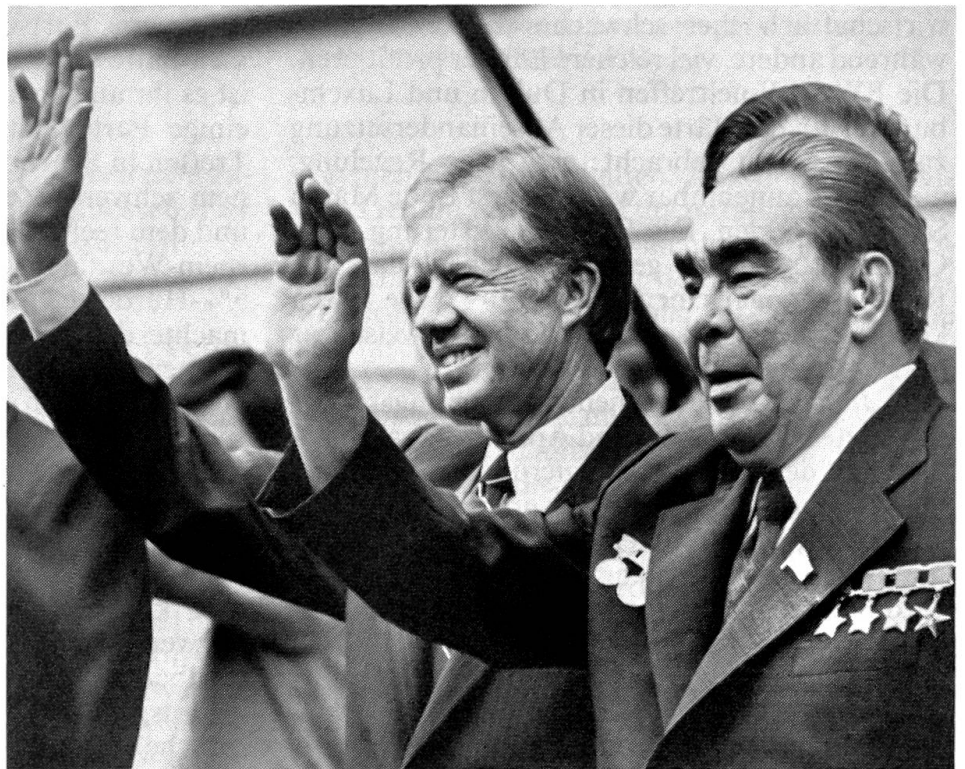
Das war noch vor dem russischen Überfall auf Afghanistan. Präsident Jimmy Carter (links) und Staatschef Leonid Breschnew anlässlich von Abrüstungsgesprächen in Wien.

Carter hat unmissverständlich zu verstehen gegeben, dass der Versuch einer Abwürgung der Ölversorgung im Mittleren Osten für die Vereinigten Staaten einen Kriegsgrund abgäbe. Zur Untermauerung dieser Erklärung sind Vorbereitungen getroffen worden, eine besondere Interventionstruppe mit 110 000 Mann aufzustellen, die so ausgerüstet wird, dass sie an jeder beliebigen Stelle der Welt jederzeit eingesetzt werden und während mindestens zwei Monaten unab-