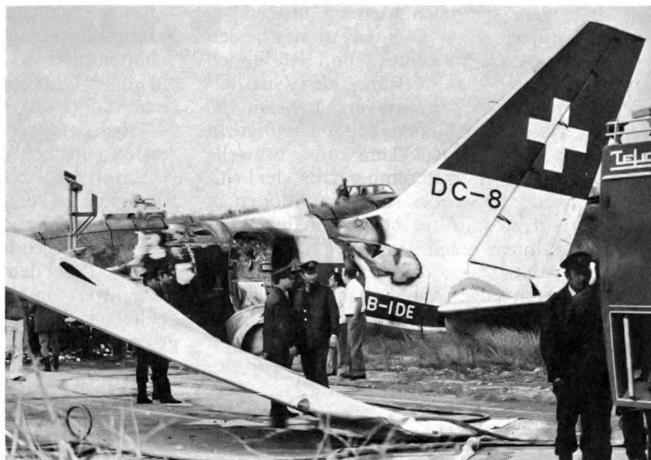
Swissair-Unglück in Athen

Dem Blick auf die politische Szene in Übersee zeigt sich ein sehr unruhiges Bild. In Südkorea ist der langjährige, mit diktatorischer Gewalt herrschende Präsident Park Tschung-Hi von seinem Geheimdienstchef ermordet worden. In Indien ist im Gefolge von Wahlen die vormalige Ministerpräsidentin Indira Gandhi im Triumph wieder an die Spitze der Regierung zurückgekehrt. Israel hat weitere Teile des Sinai geräumt und nach einer mehr als 100% betragenden Inflation eine Währungsreform durchgeführt. Das entwertete israelische Pfund ist durch den Schekel abgelöst worden. Das politische Schicksal von Cis-Jordanien ist immer noch ungelöst; wegen der israelischen Siedlungspolitik in den besetzten arabischen Gebieten ist es neuerdings zu harten Auseinandersetzungen gekommen. Der Frieden mit