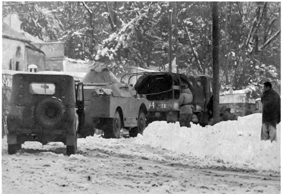
Brutaler Überfall Russlands auf Afghanistan Afghanische Heckenschützen bekämpfen einen sowjetischen Panzer- und Lastwagenkonvoi beim Einmarsch in Kabul.

Das Anziehen der Schraube im Innern der Sowjetunion ging Hand in Hand mit aggressiveren Tönen in der Aussenpolitik. Die Rückkehr zu einer neuen Ära des Kalten Krieges ist im Verhältnis zwischen den USA und der UdSSR schon heute Tatsache, und im Verhältnis zwischen der UdSSR und den NATO-Staaten steht sie unmittelbar bevor. Man bemüht sich indessen immer noch, wenigstens gegenseitig im Gespräch zu bleiben. Randerscheinungen sind, dass die Sowjetunion in der Dritten Welt ausserhalb des Kreises ihrer Klientenstaaten Sympathie und