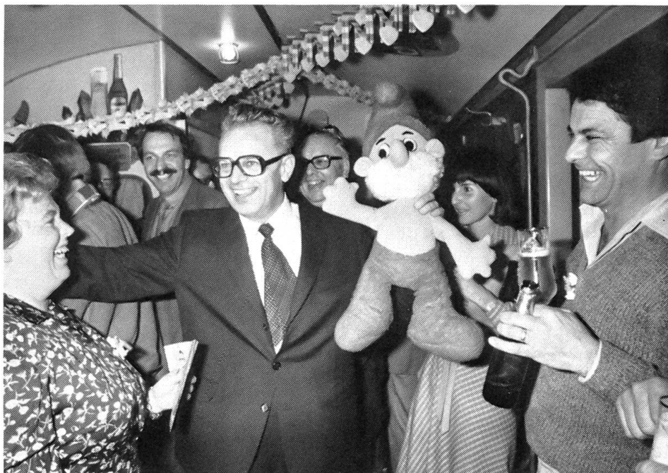
Der neue Bundesrat: Leon Schlumpf Begeistert feierten die Bündner ihren neuen Bundesrat.

In der Folge geriet auch eine Beschaffungsbotschaft für 207 Panzerhaubitzen des amerikanischen Typs M-109 unter Beschuss, weil die Kaufsumme von 890 Millionen im Lichte der Preise früherer Beschaffungen dieser Art als übertrieben erschien. Es sollte sich zeigen, dass die Mängelrüge von Divisionär Häner am Panzer 68 in allen Teilen gerechtfertigt war. Die Behebung früher aufgelisteter Mängel hatte bei den jüngeren Serien des Schweizer Panzers 68 zu neuen Mängeln geführt! Die vierte Serie soll erst fertiggebaut werden, wenn alle bedeutenderen Mängel behoben sind. In der Herbstsession wurde dann aber, nachdem genügende Unterlagen und Auskünfte vorgelegt worden waren, wenigstens die