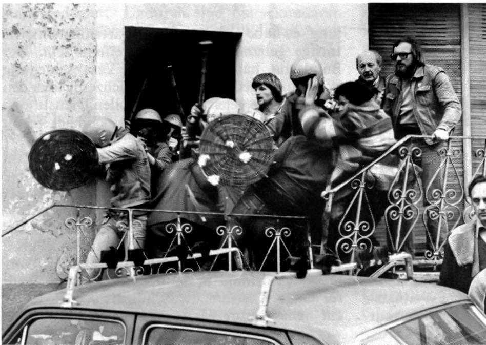
Der Jura kommt kaum zur Ruhe Berntreue Extremisten versuchen, eine Versammlung des Rassemblement Jurassien im bernischen Cortébert zu stören.

Das RJ hat zunächst die auf den 11. Mai 1979 vorgesehene Feier zur Gründung des Kantons Jura durch Drohungen gesprengt. Die Regierung des Kantons Jura sah sich gezwungen, die Feierlichkeiten in Delsberg kurzfristig abzusagen. Der Stein des Anstosses ist formell die Tatsache gewesen, dass Bundesrat Furgler ebenfalls zur