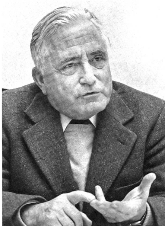
Georges-André Chevallaz Bundespräsident für das Jahr 1980

Es ist den Russen auf Anhieb nur gelungen, die grösseren Städte und das Hauptnetz der Verbindungsstrassen unter ihre Kontrolle zu bringen; mehr vorderhand nicht. Die Annahme ist naheliegend, dass es sich um eine politische Fehlkalkulation der Konsequenzen einer Operation dieser Art gehandelt hat, aus welcher Moskau sich, als der Irrtum offenbar wurde, nicht mehr ohne krassen Gesichtverlust glaubte zurückziehen zu können. Das afghanische «Abenteuer» des Kreml ist zu einer sehr beträchtlichen aussenpolitischen Belastung der Sowjetunion geworden. Sie steht vor den Augen der übrigen Welt als Ag-