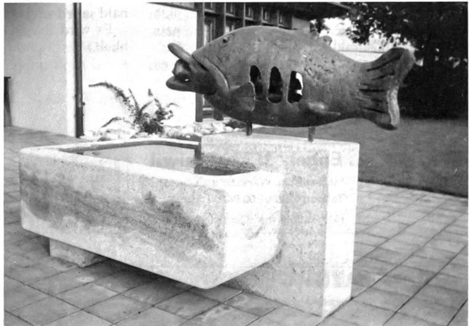
Jonas-Brunnen in Seedorf

Dagegen protestierte ich. Nun schmiegte sie sich ganz an meine Brust und sagte dabei, ohne mich anzusehen: