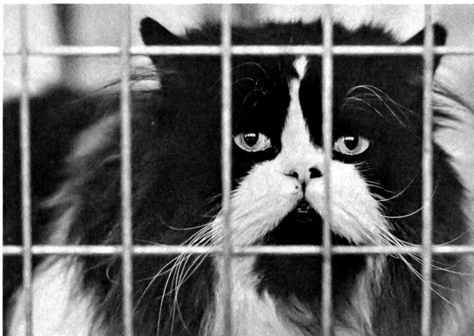
Von einer Katzenausstellung Es scheint «ds Büsi» zu interessieren, was da der Photograph im Sinn hat.

der ein und schienen mich gerne bei sich zu sehen.