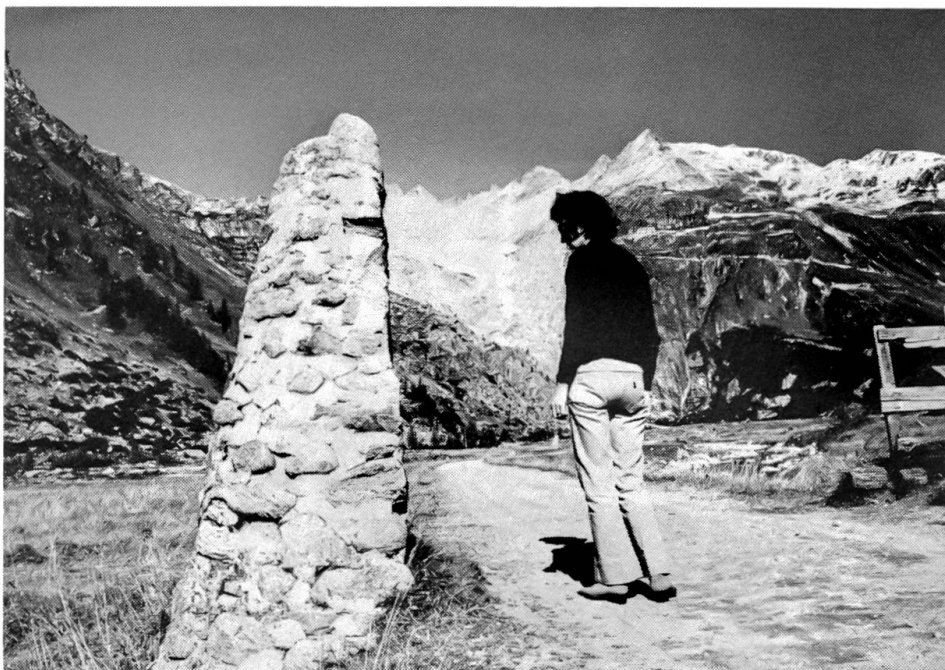
Der Rhonegletscher wächst wieder.

Die Liebe zwischen Mann und Frau mag noch so tief verankert sein, im Innersten stehen sie sich seelisch doch fremd gegenüber. Sie bleiben stets zwei Kriegsführende, sind verschiedener Wesens-