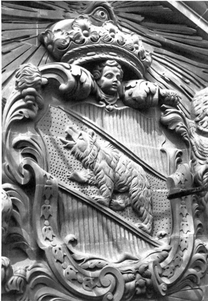
Das Berner Kornhaus prächtig renoviert Fünf Jahre dauerten die Renovationsarbeiten am Kornhaus in Bern. Unser Bild zeigt ein Kernstück: Das Berner Wappen im Giebelrelief der Ostseite.

tigi mit farbige Chrugli usere alte Wiehnachts- trucke; sogar e Pölzerlarve (Samichlausmaske) mit lengem wyssem Bart isch vüricho. Wil si nid sy iinig worde, wär de ds Schlossfröilein törfi mache, hii si bschlosse, sich beedi z'ver- chliide u mit der Erschynig abzwächsle. Si hii alls zemepackt u sy dür ds obere Dörfli gschli- che bis zum letschte Huus underem Schloss. Si hiis guet priicht, niemer isch um d'Wäge gsy. Uf der hindere Luube hii sich beedi hübscheli verchliidet. D'Hemmleni vo der Urgrossmueter hii si chönne ubere Bode schliipfe wie ne Schleppe. Ds Marili hett sich mit Flitterzüg