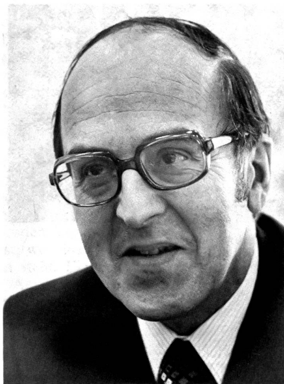
Dr. Kurt Furgler Bundespräsident für das Jahr 1981

Auch die Sowjetunion ist nicht frei von wirtschaftlichen Schwierigkeiten. Hier hat nicht zuletzt das amerikanische Embargo auf technologischem Know-how und, in geringerer Masse, auf zusätzlichen Getreidelieferungen die Versorgungslage nach und nach verschlechtert. Allerdings haben im gleichen Zeitraum die grossen sowjetischen Energielieferungen nach dem Westen (Erdöl und Erdgas, aber auch Elektrizität) eine bemerkenswerte Verbesserung der Aussenbilanz und einen Rückgang der Aussenverschuldung ermöglicht. Hauptgründe der internen Schwierigkeiten sind aber wie eh und je die Verbürokratisierung aller Wirtschaftsabläufe, die die Produktion hemmt, sowie Fehlplanungen und schlechtere Ernteerträge als üblich.