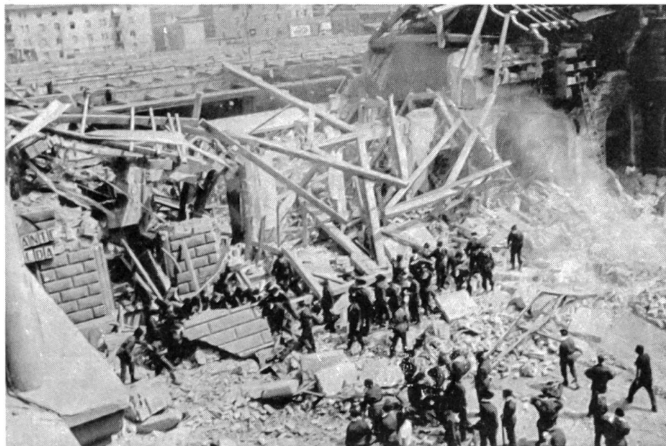
Attentat auf den Bahnhof von Bologna Dieser Terroranschlag forderte gegen 100 Todesopfer und viele Verletzte, darunter auch Schweizer Touristen.

In der Bundesrepublik Deutschland haben am 5. Oktober die Bundestagswahlen stattgefunden, die für die Regierungskoalition SPD/