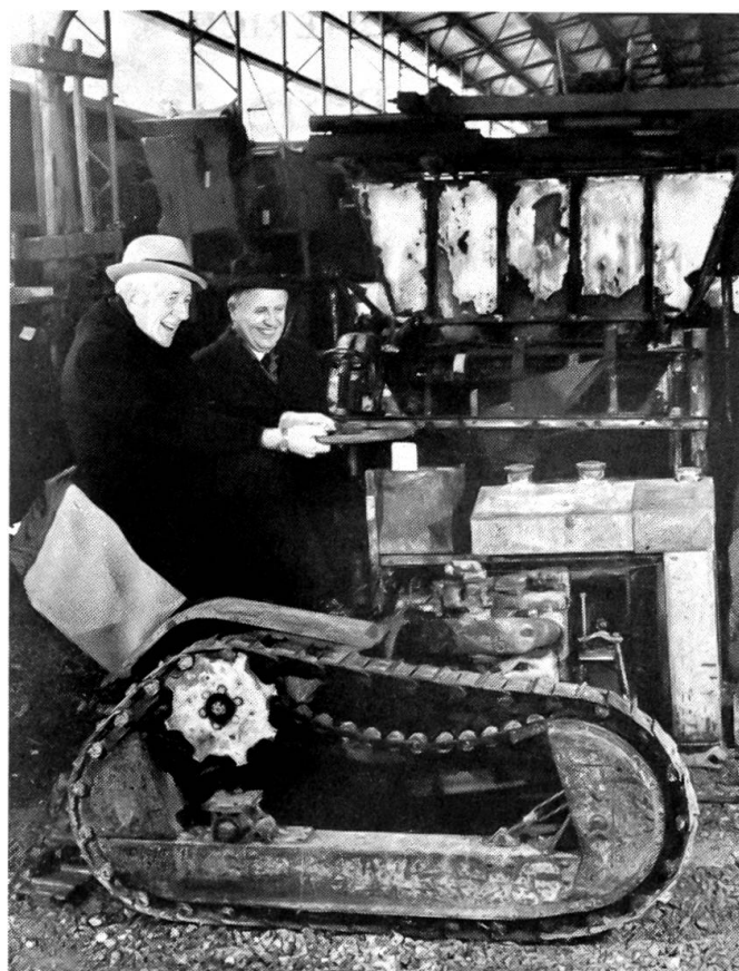
Die Landmaschinensammlung Zweiacker nun in Belp eingelagert

Ungewissheit herrscht hinsichtlich des Schicksals des Flugplatzes Belpmoos. Nachdem im Jahre 1980 ein von der Alpar AG vorgelegtes Ausbauprojekt des Berner Flugplatzes abgelehnt worden war, erteilte die Berner Regierung der Alpar den Auftrag, ein reduziertes Ausbauprojekt vorzulegen. Auf Grund dieses weniger umfangreichen Projekts wäre eine Fortsetzung des Flugbetriebs mit kleineren Passagierflugzeugen möglich geblieben. Aber in einer Gemeindeabstimmung vom 5. April sind die der Alpar bisher zur Verfügung gestellten jährlichen finanziellen Beiträge der Stadt Bern an den Unterhalt und Betrieb des Flugplatzes verweigert worden. Dadurch ist die Finanzierung in Frage gestellt worden. Die Betriebskonzession für den Flugplatz wäre auf den 31. Mai ausgelaufen, doch hat das EVED eine vorläufige Verlängerung der Konzession bis zum 31. Dezember 1982 zugestanden. Damit konnte Zeit für eine andere Lösung gewonnen werden. Ab 1. Juli sollen allerdings weitere Flugeinschränkungen zwecks Verminderung der Lärmbelastung in Kraft treten. Die Alpar sucht durch eine stärkere Belastung der Flugplatzbenützer die Deckung der Kosten des Flugplatzbetriebs herbeizuführen. Es sind aber auch Drohungen laut geworden, dass die Alpar ihre Liquidation beschliessen könnte, bevor sie durch grössere Defizite konkursreif