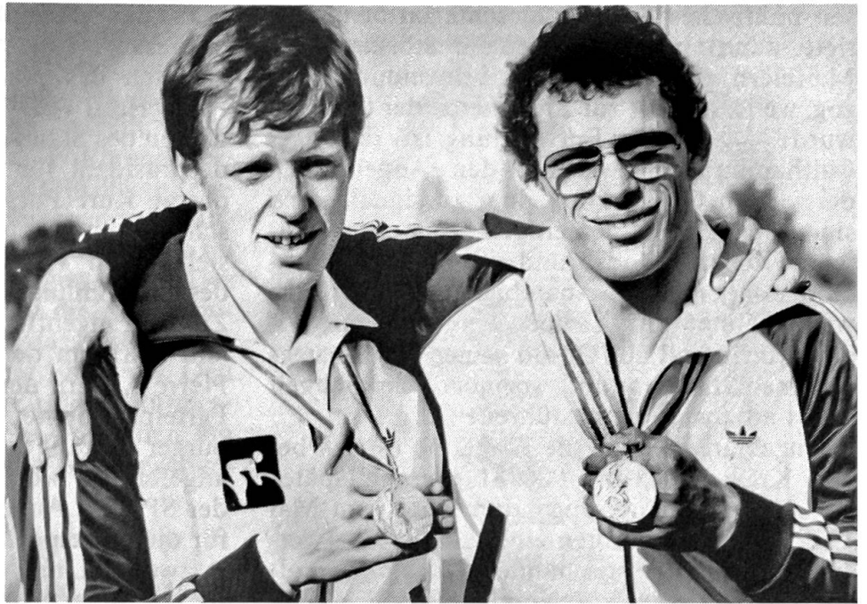
Zwei Goldmedaillen für die Schweiz Robert Dill-Bundi (links) in der Rad-Einzelverfolgung und Jürg Röthlisberger im Judo holten an den Olympischen Sommerspielen in Moskau je die höchste Auszeichnung.

An der Oberfläche konzentrierte sich der irrationale Ausbruch jugendlicher Aggressivität auf die Forderung nach Gewährung von autonomen Jugendzentren. Aber die Tatsache, dass die Bewegung nach Zugeständnissen solcher Zentren keineswegs abgeflaut ist, stellt einen untrüglichen Hinweis dar, dass mindestens bei einem Teil der jungen Generation eine in der Tiefe des Seelenlebens verwurzelte Absonderung und soziale Desintegration stattgefunden hat, die zu ernsteren Besorgnissen Anlass gibt.