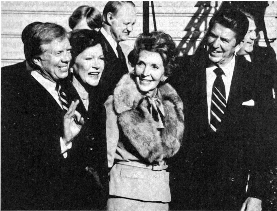
Überraschung bei den Präsidentschaftswahlen in den USA Ronald Reagan (rechts, mit Gattin) schlug den bisherigen Amtsinhaber Jimmy Carter und wurde neuer Präsident der Vereinigten Staaten von Amerika.

Afghanistan von diesem armen Entwicklungsland und von der Welt insgesamt als Fait accompli schliesslich hingenommen werde. Die Sowjetunion sieht sich immer noch mit einem hartnäckigen Widerstand im besetzten Afghanistan konfrontiert. Die von den Russen eingesetzte nominelle Regierung Karmal kann sich bloss mit Mühe und dank der sowjetischen Bajonette halten. Mittlerweile hat sich ein Flüchtlingsstrom, der vermutlich einen Fünftel der afghanischen Bevölkerung erfasst hat, über die Grenzen ergossen, namentlich nach Pakistan. Der Schreckschuss von Afghanistan hallt immer noch vernehmlich durch die ganze islamische Welt und durch internationale Konferenzen jeder Art. Die im Sommer 1980 in Moskau durchgeführte Olympiade stand völlig unter dem negativen Zeichen dieser offensichtlich verkalkulierten Aggression der Sowjetunion. Eine grössere Zahl von Ländern, so auch die