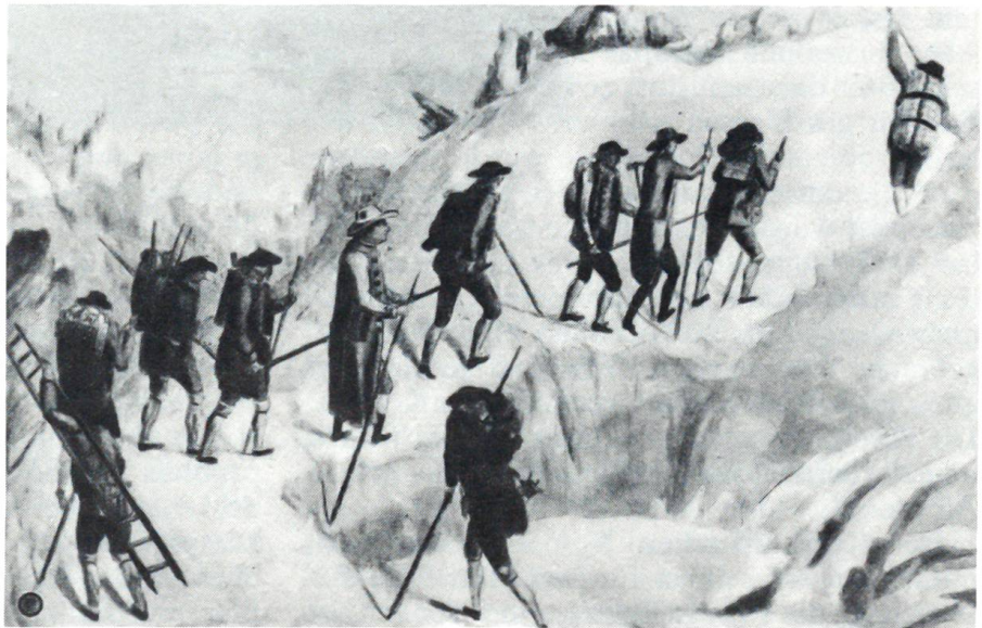
Bergsteiger beim Begehen eines Gletschers gegen das Ende des 18. Jahrhunderts. Der Rucksack war noch unbekannt, Tornister und Tragkörbe ersetzten ihn. Als ein wichtiges Requisit wurde eine Leiter mitgetragen.

Als um die Mitte des 19. Jahrhunderts Gipfel um Gipfel erobert wurden, führte man für Damen und marschuntüchtige Personen die sogenannten «Tragsessel-Routen» ein. Noch im Baedeker von 1869 sind solche Touren angeführt, z. B. die Rigi und das Faulhorn. Die Kosten für das Hinauftragen durch 4 Mann auf einem Tragsessel mit langen Stangen beliefen sich, nach dem heutigen Kaufwert des Geldes jener Jahre berechnet, etwa auf 90 Franken. Bis gegen 1880 wurden viele Aussichtsgipfel auf solche Art besucht, dann aber war dieses «Bergsteigen» überlebt. Es wurden bessere Wege und Berggasthäuser gebaut, und der 1863 gegründete Schweizerische Alpenclub sorgte für hochalpine Unterkünfte. In der Ausrüstung der Bergfreunde verschwanden Zylinderhut und Frack, Tragkörbe und Leitern. Die Seiltechnik wurde entwickelt, und auch Einzelgänger erreichten hohe Gipfel. Die Kindertage des Alpinismus hatten damit ihr Ende gefunden.