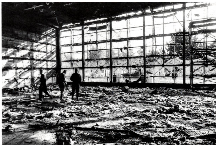
Turnhallenbrand in Bern

«Wie ich höre, hat Bob dir so einen wunderschönen Verlobungsring geschenkt, rundherum mit Rubinen und Brillanten, und trotzdem hast du die Verlobung wieder gelöst», sagte die Freundin. «Was ist denn nur passiert?» – «Ach, weisst du, meine Gefühle für ihn haben sich eben geändert.» – «Und da hast du ihm den Ring zurückgegeben?» – «Wieso das denn? Meine Gefühle für den Ring hatten sich doch nicht geändert.»