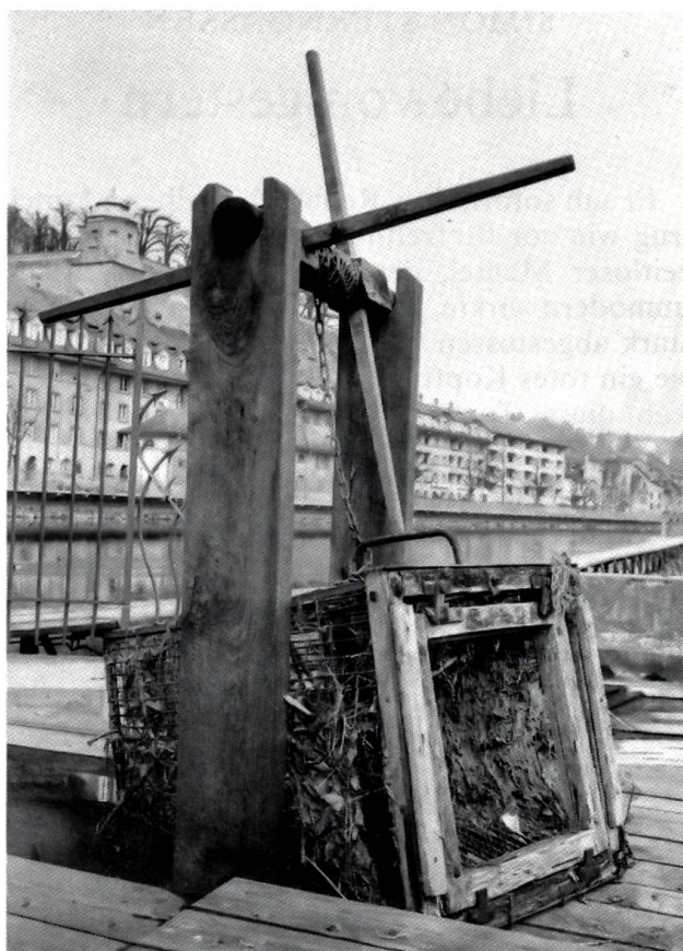
Fischfang wie zu Grossvaters Zeiten

Die Fischreus, an eine Hebevorrichtung angekettet, passt genau in einen Durchgang der grossen Schwelle im Berner Schwellenmätteli. Der Fangertrag kommt ins nahegelegene Restaurant.