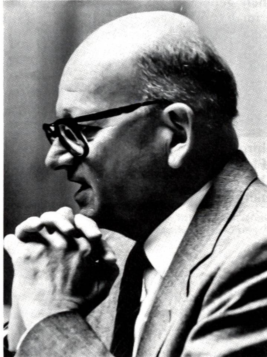
Alphons Egli Bundespräsident für das Jahr 1986

Das dadurch bewirkte starke Überangebot auf dem Weltmarkt wirkte wie ein Dambruch auf die bislang künstlich hochgehaltenen Preise. Der Ölpreis purzelte in wenigen Wochen und Monaten bis auf ca. 10 Dollar pro Fass herunter, um sich dann etwa bei 15 Dollar neu einzupendeln. Die Auswirkungen dieses in seinem Ausmass unerwarteten Preiszerfalls sind enorm: Die Importländer kommen nun in den Genuss eines Milliarden-Bonus in der Zahlungsbilanz, von verminderten Teuerungsraten und von zusätzlichen Impulsen in der Entwicklung ihres Wohl-