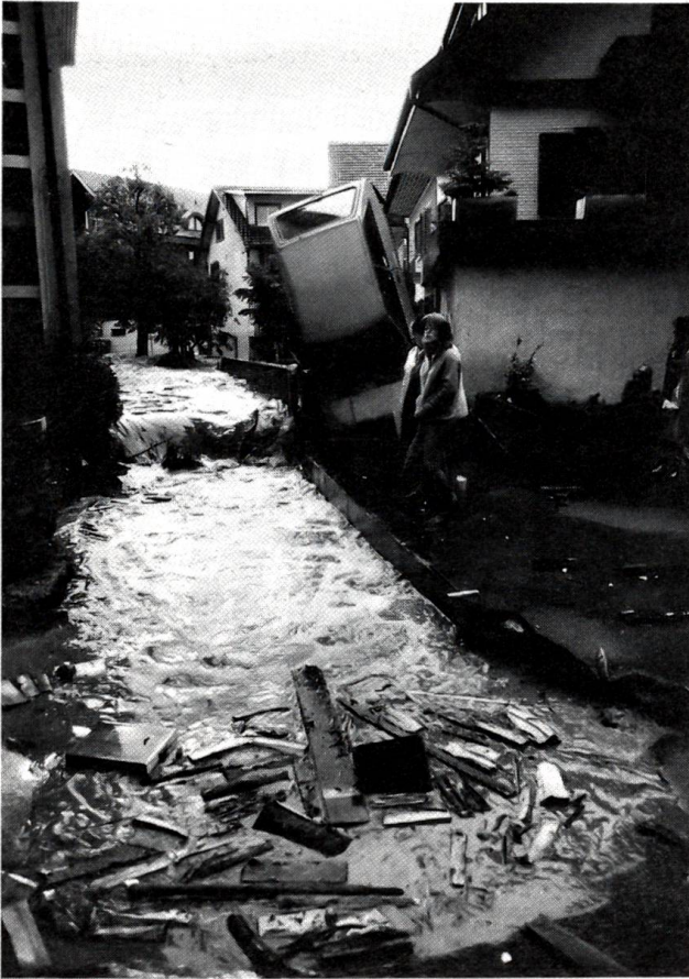
Verheerender Gewittersturm über dem Schwarzenburgerland Am 4. Juli 1985 richtete das schlimmste Gewitter seit Menschengedenken im Schwarzenburgerland und im Sensebezirk verheerende Schäden an Fluren, Strassen und Gebäuden an.