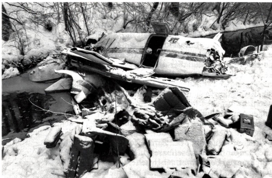
Flugzeugabsturz bei Bern am 3. März 1986

In der Chronik der Schweiz figurieren im Berichtsjahr wieder wie üblich Volksabstimmungen von ganz unterschiedlicher Bedeutung. Am 6. Juni lehnte der Souverän die Initiative «Recht auf Leben» deutlich ab, während drei Finanzvorlagen, darunter die Streichung der Kantonsanteile bei der Stempel- und Alkoholsteuer, angenommen wurden. Am