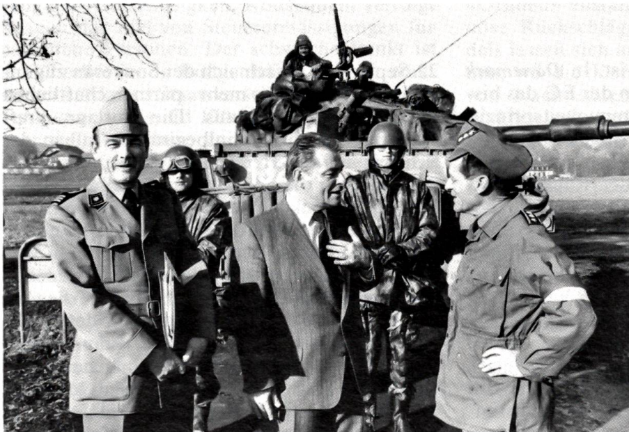
Grosse Manöver vor den Toren Berns

Die grosse Manöverübung «Feuerwagen» des Feldarmeekorps 2 spielte sich im Herbst 1985 auch in und um die Stadt Bern ab und brachte der Bevölkerung die Präsenz unserer Armee erneut ins Bewusstsein. Unser Bild zeigt den neuen Generalstabschef Eugen Lüthi (rechts) als Übungsleiter im Gespräch mit Bundesrat Delamuraz.