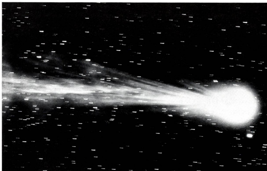
Der Halley'sche Komet in Erdnähe

Nach diesem Exkurs in die Dimension des Ökonomischen wenden wir uns nun dem poli-