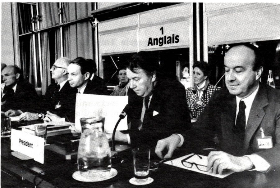
KSZE-Folgekonferenz in Bern

Gleichzeitig befindet sich Südafrika in wirt schaftlichen Schwierig keiten. Diese äussern sich in einer schweren Rezession ebenso wie in einer Liquiditätskrise, welche unter anderem wegen einer wenig weit sichtigen Schuldenpoli tik entstanden ist. Da durch und wegen des schärfer gewordenen in ternationalen Boykotts, der am 26. Juli vom Si cherheitsrat der UNO in der Form einer Empfeh lung «abgesegnet» wor den ist, ist die Währung von Südafrika mittler weile in ihrem Aussen wert stark entwertet wor den, während im Innern die Inflation weiter vor