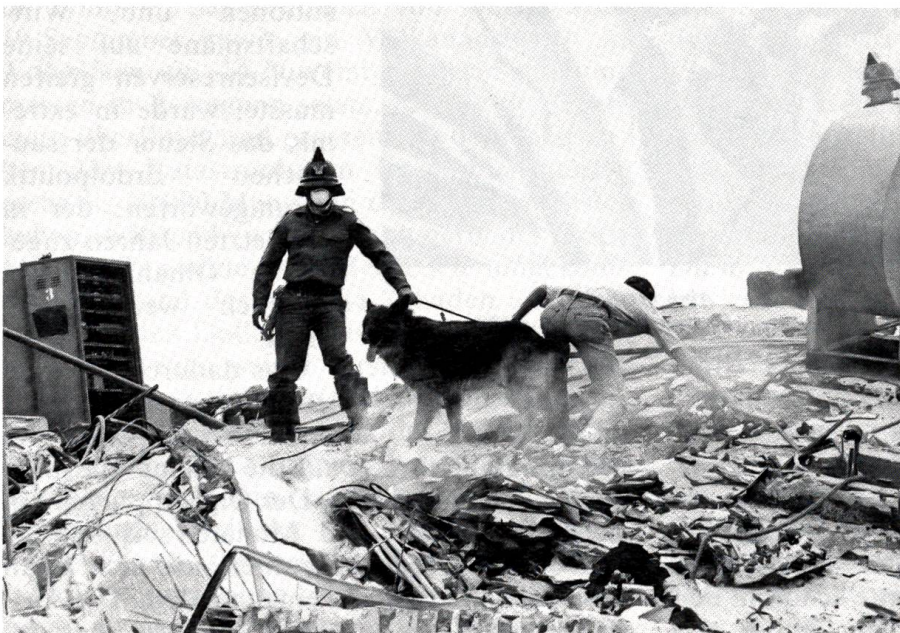
Katastrophales Erdbeben in Mexico City

Höhepunkt im Verhältnis zur Kaufkraft der amerikanischen Währung weit übertrieben, sie führte auch zu Verlagerungen und Verzerrungen in den internationalen Handelsbeziehungen. Geradezu tragisch war die Aufblähung des Verschuldungsvolumens der in Dollar verpflichteten Entwicklungsländer. Die Vereinigten Staaten, die sich in der Vergangenheit kaum je um den Aussenwert ihrer Währung gekümmert hatten, und das Niveau der Devisenkurse den freien Marktkräften anheimzustellen beliebten, sind diesmal nicht passiv geblieben. Die amerikanische Regierung konnte