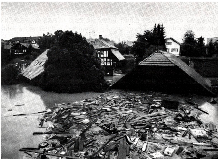
Unwetter über Schwarzenburg

Auch dieses Bild gibt einen Eindruck von der Wucht der Naturgewalten. Übrigens wurden zu den Wiederinstandstellungsarbeiten bis in den Winter hinein laufend Zivilschutzdetachemente aus dem ganzen Kanton eingesetzt.