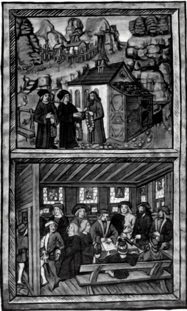
Niklaus von Flüe und das Verkommenis von Stans

Aber nahe von Basel begegnet Niklaus einem unbekanntem Bauern, der ihm seinen Plan ausredet und ihm rät, nach Obwalden heimzukehren. Als er auf offenem Feld übernachtet, trifft ihn ein Lichtstrahl, der sein Inneres für immer umwandelt und auch seine Leiblichkeit verändert. Von Stund an nährt er sich während zweier Jahrzehnte bis zu seinem Tode nur noch von den Elementen des Heiligen Abendmahls. Zu Hause zieht er sich in die nahe Ranftschlucht zurück, wo er, von Visionen heimgesucht, mit helllichtiger Klarheit die drohenden Fehlentwicklungen sowohl im persönlichen Menschenleben als auch auf der kirchlichen und staatlichen Ebene erkennt und zum Wegweiser und Mahner wird. Einzelne Ratbedürftige vorerst suchen den charismatischen Seelsorger auf, dann begeben sich Pilger und schliesslich ganze Pilgerströme zum Einsiedler in den Ranft, unter ihnen Abgesandte der eidgenössischen Stände und fremder Fürsten, die seine Fürbitte suchen oder seine Meinung erfahren möchten. Seine politische Weit-