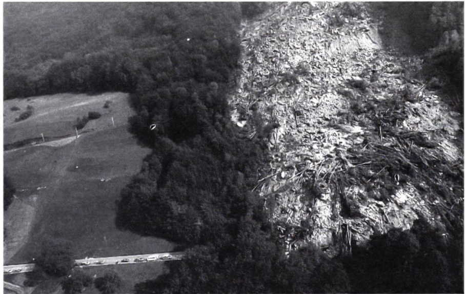
Gewaltiger Erdbeben bei Giswil OW

Bei seinem Morgenspaziergang wurde Franz Grillparzer einmal von einem Bekannten also angesprochen: «Das trifft sich ja prächtig!