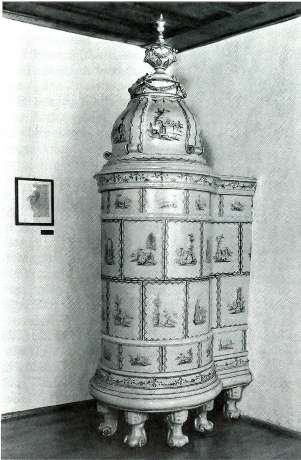
Ein einmaliges Sammlungsgut stellen die prachtvollen Landolt-Kachelöfen dar.

und wertvolle Gegenstände aus dem Besitz der drei einstigen Neuenstädter Zünfte bereichern die Sammlung schliesslich nach der lokalhistorischen Seite hin.