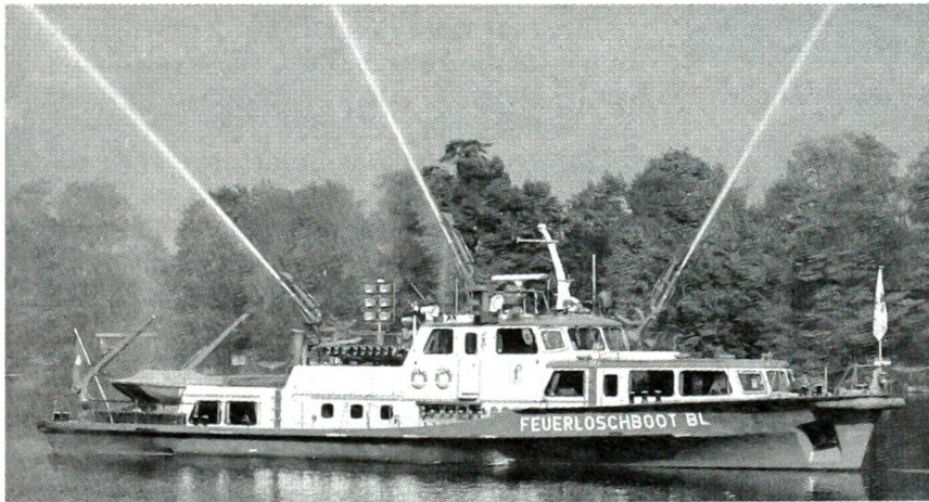
Feuerlöschboote in der Schweiz

Die Kantone Basel-Stadt und Baselland verfügen je über ein Feuerlöschboot zum Schutz der Rheinhafenanlagen und zum Einsatz auf dem Rhein. Diese Boote sind 29 Meter lang, 6,4 Meter breit, haben eine Wasserverdrängung von 108 Tonnen und erreichen eine Geschwindigkeit von 20 Stundenkilometern.