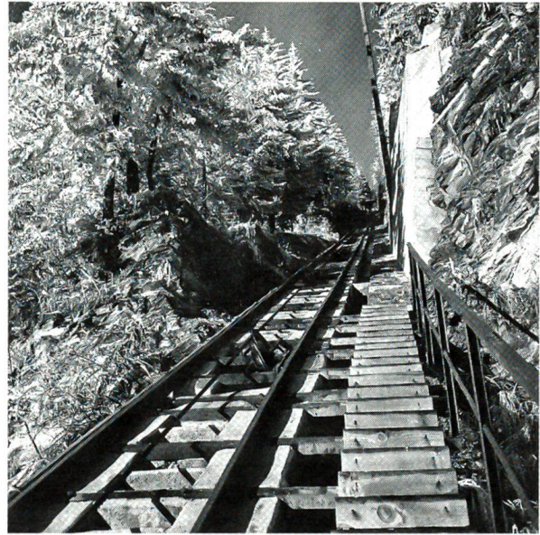
Gute Kondition gefragt – die längste Treppe der Welt Die Diensttreppe der Niesenbahn von der Talstation Mühlenen bis zum Niesen-Kulm (2362 m) weist 10 564 Tritte auf.

Und der Klang seiner Worte stand in merkwürdigem Gegensatz zu der herausfordernden