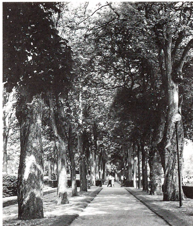
Eine der herrlichen Alleen im Rosengarten über der Stadt Bern

In den vergangenen Jahren war die Weiterbearbeitung, Vertiefung und Konkretisierung der grünplanerischen Grundlagen für das Stadtent-