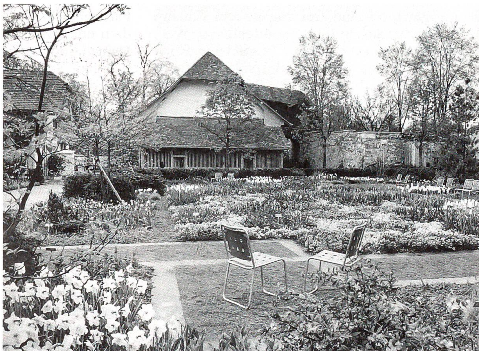
Die Aussenanlagen des Stadtgärtnereibetriebes in der Elfenau stehen dem Besucher offen.

sich durch eine starke bauliche Entwicklung in der Stadt Bern und folglich eine Zunahme öffentlicher Grünanlagen aus. Vor allem in den sechziger Jahren wurden durch die Stadtgärtnerei neue Aufgaben übernommen, die Bau- und Unterhaltsarbeiten nahmen zu und die Betriebsanlagen, insbesondere die Gewächshäuser mit der Produktion, mussten vergrössert und modernisiert werden. Die gesamte Stadtgärtnerei, zu welcher die Betriebsgebäude, die Kulturräume und die mechanische Werkstätte gehören, wurde sorgfältig in den historischen Park eingegliedert. Die Aussenanlagen sind so konzipiert, dass Elfenau-Besucher auch heute noch in die vielfältige Tätigkeit des Betriebes Einsicht nehmen