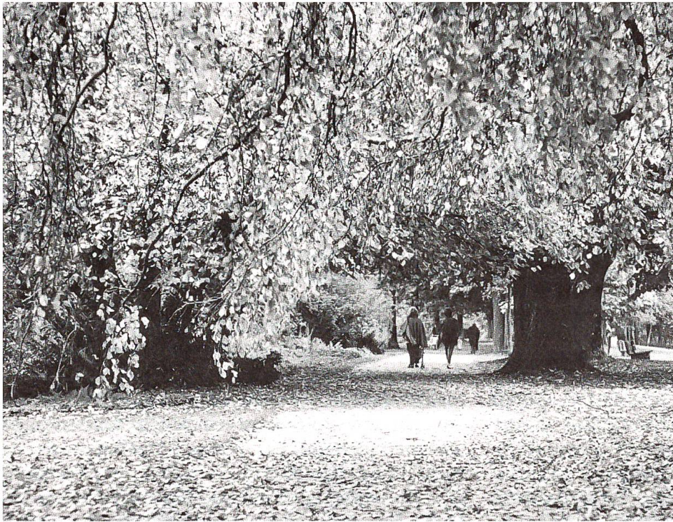
Der Elfenupark als Naherholungsgebiet der Stadt Bern

können. Freilandkulturen, Baumschule und Staudengärtnerei sind frei zugänglich. Entlang den Gewächshäusern führt ein öffentlicher Weg, welcher dem Besucher einen besonderen Blick auf die Kulturen gewährt. Besonders anfangs Mai bietet sich hier eine Augenweide, wenn Tausende von blühenden Geranien in den Gewächshäusern stehen und darauf warten, zum Schmuck öffentlicher Gebäude abgeholt zu werden. Von den neun Gewächshäusern ist das erste als öffentliches Schauhaus eingerichtet. Es enthält eine Vielzahl attraktiver Pflanzen aus tropischen und subtropischen Zonen sowie eine kühlere und feuchtere Ecke mit eher trockenheitsliebenden Sukkulente und Kakteen. Als wichtiges Naherholungsgebiet der Stadt finden sich im Elfenu-Park schliesslich verschiedene Spielmöglichkeiten für gross und klein, die ebenfalls von der Stadtgärtnerei gepflegt und unterhalten werden.