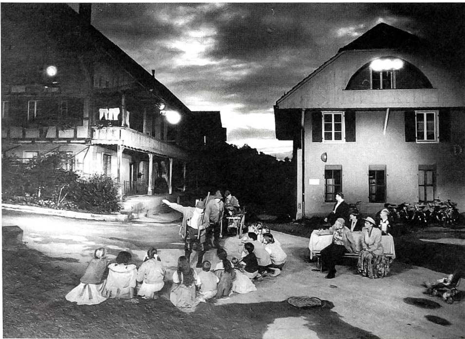
Grosser Erfolg für das «Schärmespil» in Ittigen Sämtliche Vorstellungen dieser Freilichtaufführung mit Laienschauspielern waren innert weniger Tage ausverkauft. Verfasser des stimmungsvollen Stückes ist Hans Stalder aus Ittigen.

dem Dachgiebel aufgehängt bewahrte. Auch ein Heidenhaus bei Wattenwyl hat einen Ochsenkopf aufzuweisen. Bei anderen ist in Erinnerung an den wirklich vorhandenen natürlichen Ochsenkopf ein anderer als Ersatz aus dem Holz ausgehauen und gilt als Schutz vor Feuer und Blitz. In Radelfingen hatten mehrere der ältesten Häuser noch vor kurzem und haben zum Teil noch heute unter dem Strohdachfirst grosse Ochsenköpfe mit Hörnern. Man sagt, die Heiden hätten damit die Häuser vor Feuer sichergestellt.