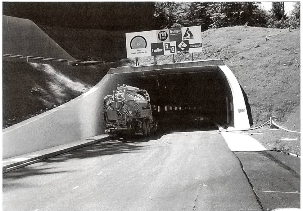
Umfahrung von Leissigen vor seiner Fertigstellung Das Bauwerk wurde Ende Juni 1994 dem Verkehr übergeben. Unser Bild zeigt das Tunnelportal auf der Ostseite.