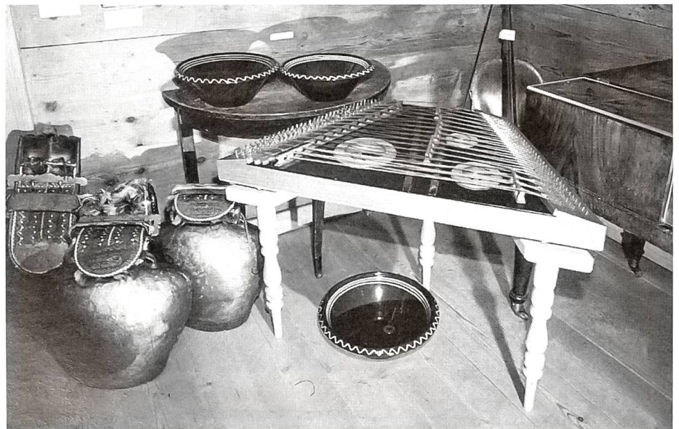
Am Hackbrett, mit den Talerbecken und den Senntumsschellen kann sich der Besucher aktiv betätigen.

lich jeweils von 13.30 Uhr bis 17.00 Uhr. Besuche ausserhalb der Öffnungszeiten und Führungen können telefonisch bestellt werden bei 071/58 14 87 (Hauswart) oder 071/58 23 22 (Museum).