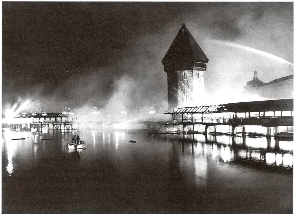
Brand der Kapellbrücke in Luzern

«Guten Tag!» rief ihm in diesem Augenblick ein gut genährter Radfahrer zu, wobei er mit der