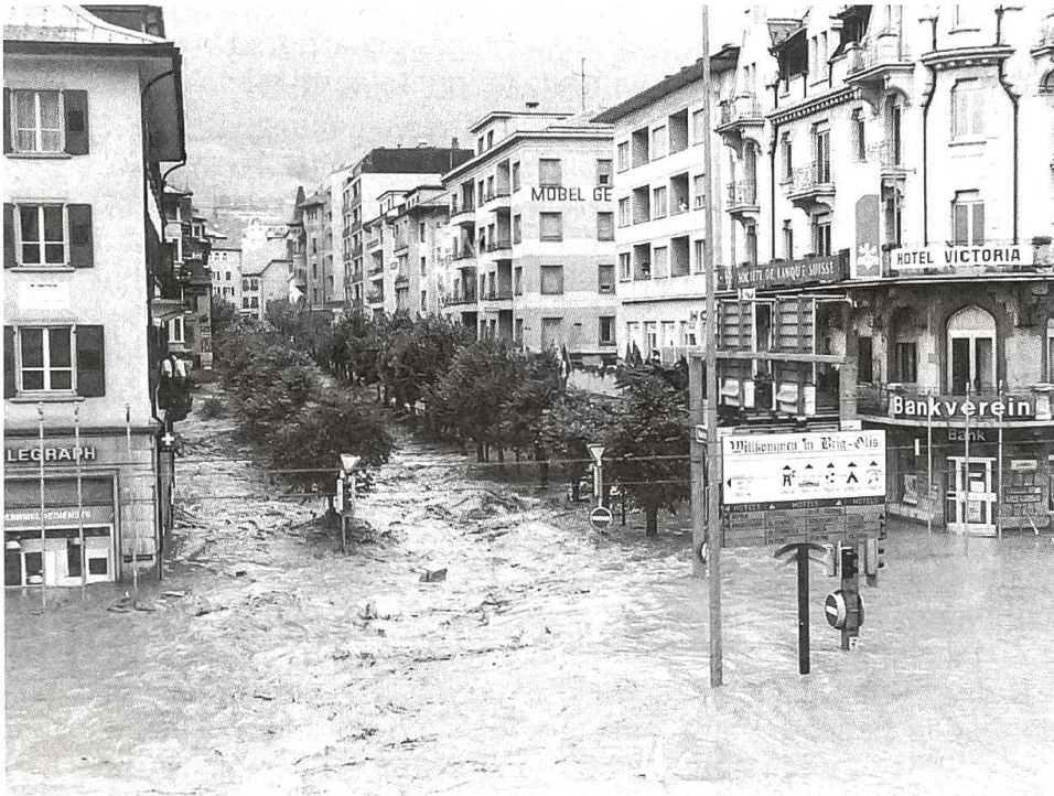
Verheerendes Hochwasser in Brig

büro kommen, wo er die eingegangene Post für den ganzen Betrieb zu öffnen und zu verteilen hat, Max wird im Schweisse seines Angesichts die Schreibmaschine traktieren, die Fernschreiber werden rattern, die Telefone klingeln, die Rohrpost wird unermüdlich ihre Hülsen ausspucken, und Herr Bichsel wird mit Frau Moser wahrscheinlich in ein lautstarkes Gespräch über die entscheidende Frage «Fenster geöffnet oder geschlossen» verwickelt sein. Ein dankbares, nie versiegendes Thema, an dem sich seit der Erfindung des Fensters schon unzählige Generationen er-