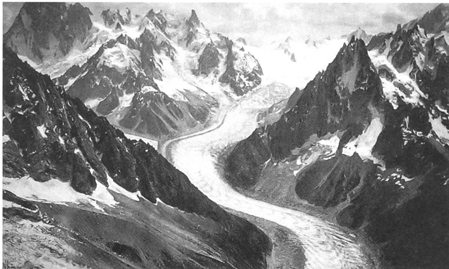
Montblanc-Gruppe aus ca. 3200 Meter über dem Chamonixtal Aufnahme aus dem Ballonkorb von Eduard Spelterini am 8. August 1909

unter. Zu ihrer grossen Überraschung fanden sie an der Pierre-Pointue ein ausgiebiges Frühstück vor, das ihnen Freunde entgegengetragen hatten. Sie hatten auch ein Maultier mitgebracht, das Mademoiselle hätte zu Tale tragen sollen. Aber sie weigerte sich, es zu besteigen. Sie wollte nicht den Eindruck erwecken, erschöpft zu sein.