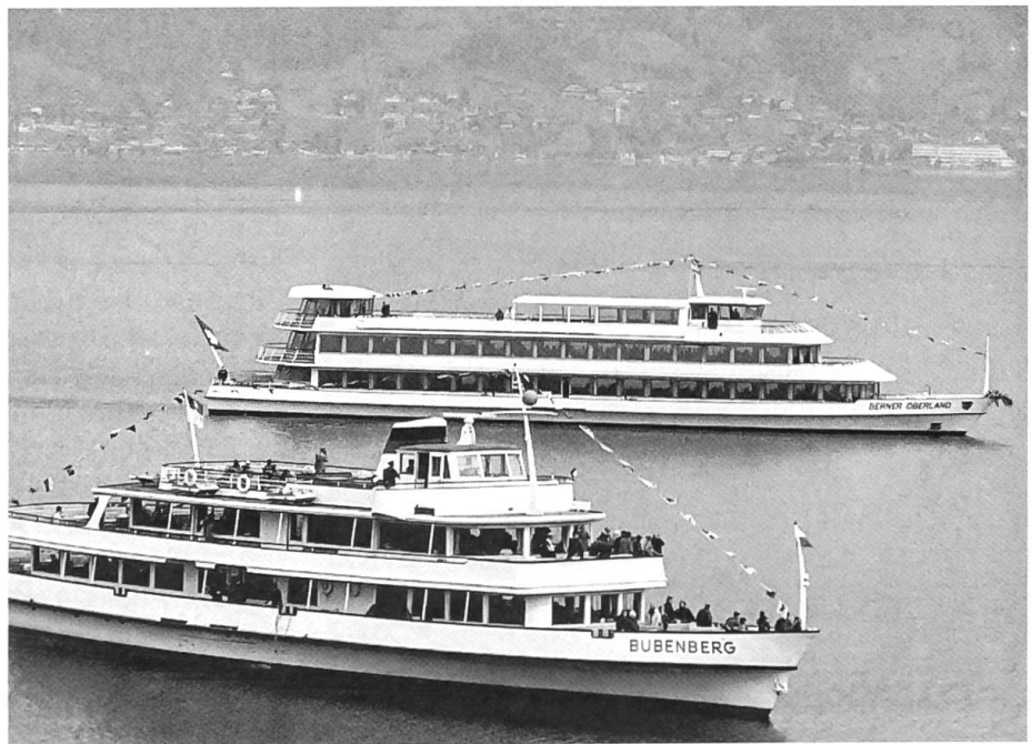
Neues Thunerseeschiff «Berner Oberland»

«Ich brauche keine Berichte über das Leben der Spinnen, sondern ich brauche eine Spur von