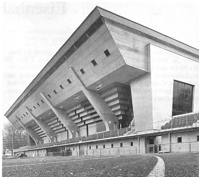
Neue Sporthalle Wankdorf in Bern fertiggestellt

«Marijke, ich ...», Gregor sah sie bestürzt an, «ich ...»