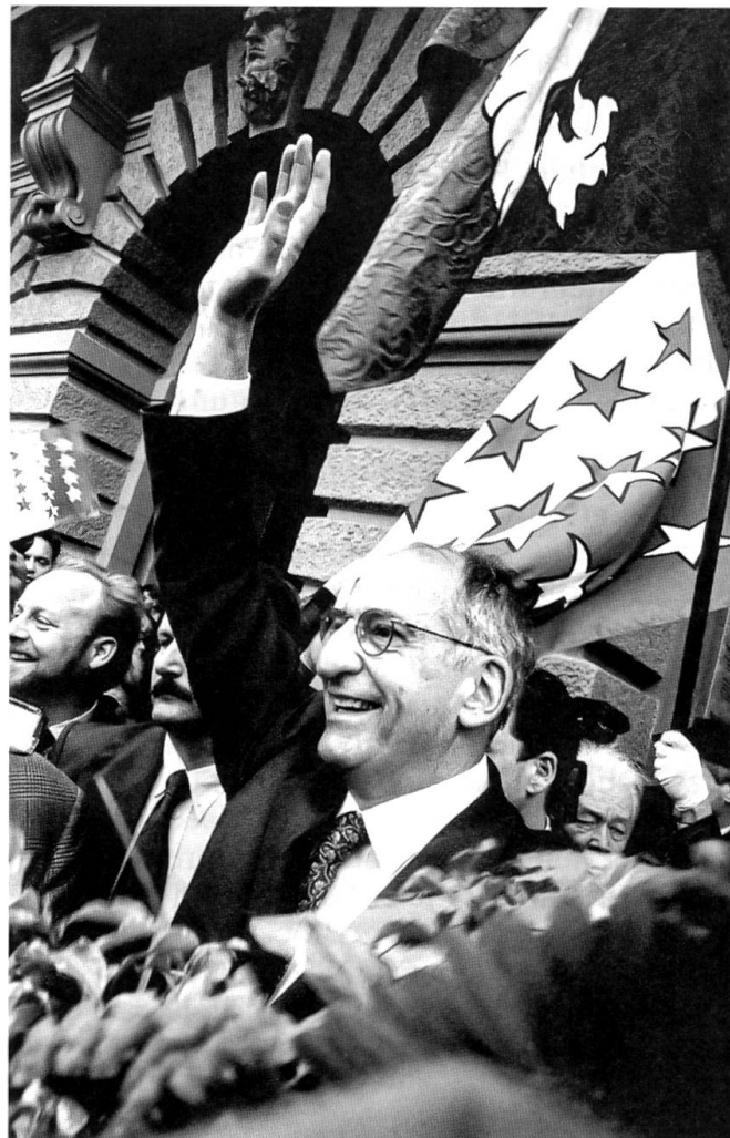
Ein Walliser wird neuer Bundesrat Pascal Couchepin, Stadtpräsident von Martigny, wird als Nachfolger von Jean-Pascal Delamuraz zum neuen Bundesrat gewählt.

Bemerkenswert ist, dass die amerikanische Aussenpolitik seit einiger Zeit die Absicht bekundet, die immerzu gespannten Beziehungen zur Volksrepublik China markant zu verbessern. Sichtbarer Ausdruck dieser Klimaveränderungen in den gegenseitigen Beziehungen ist der Besuch des chinesischen Präsidenten Jiang Zemin im Oktober 1997 in Amerika, dessen Höhepunkt ein Treffen mit Clinton gewesen ist. Vorsichtigerweise wurde in den Gesprächen ein Disput über die nach wie vor unvereinbaren Vorstellungen über Natur und Geltung der Menschenrechte vermieden; aber es ist doch kein Zufall, dass der Anführer der Dissidenten auf dem Tiananmen-Platz mit dem Massaker an den Studenten, Wang Dan, nun am 19. April aus dem Gefängnis entlassen und nach Amerika abgeschoben worden ist. Günstig für die weiteren Beziehungen dürfte auch sein, dass am nationalen Volkskongress in Peking im März 1998 die Ablösung von Ministerpräsident Li Peng durch Zhu Rongji erfolgt ist. Es ist offensichtlich geworden, dass nunmehr in China der internen Wirtschaftsentwicklung und der Bekämpfung der in allen Staats- und Lebensbereichen wuchern den Korruption vor den Dogmen der kommunistischen Ideologie Priorität eingeräumt wird. Es scheint auch, dass nach der Rückkehr von Hongkong die nationalistischen aussenpolitischen Aspirationen wenn nicht aufgegeben, so doch zurückgestellt werden. Die Entspannung mit China hat einen heiklen Aspekt im Zusammenhang mit der amerikanischen Allianz mit