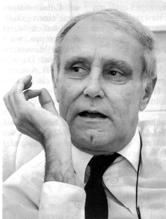
Flavio Cotti Bundespräsident für das Jahr 1998

euphorisch vorgeschwebt hat. Diese Kraft reicht aus, in geopolitischen Konflikten den Schiedsrichter zu spielen und in punktuellen Gebieten der Erde, die für die USA und ihre Alliierten von entscheidendem strategischem und wirtschaftlichem Interesse sind, mit oder ohne die UNO, andere internationale Organisationen und Verbündete das Überhandnehmen von Chaos, Terror und sporadischen Kriegshandlungen zu verhindern oder einzudämmen. Sie reicht aber nicht aus, überall und jederzeit die Rolle des «Weltpolizisten» zu übernehmen, der eine allseits respektierte Friedensordnung durchsetzt. In seinem 1997 erschienenen Buch «Die einzige Weltmacht» schreibt der Sicherheitsberater von Präsident Carter, Zbigniew Brzezinski : «Inwieweit die USA ihre globale Vormachtstellung geltend