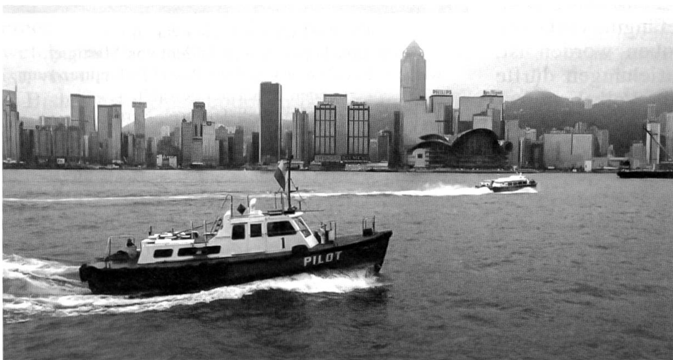
Hongkong wird chinesisch

Mit Clintons Besuchsreise nach sechs Ländern Afrikas hat zum ersten Mal ein amerikanischer Präsident seinen Fuss auf den Boden des Schwarzen Kontinents gesetzt. Es ist dies ein klares Indiz dafür, dass das Interesse der USA an Afrika neuerdings stärker erwacht. Vor allem Westafrika wird in Zukunft wohl nicht