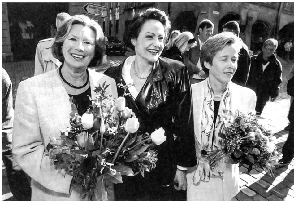
Drei Frauen in der Berner Regierung