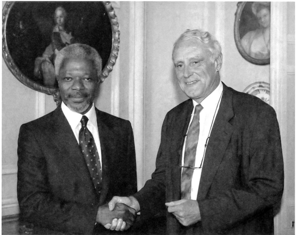
UNO-Generalsekretär in Bern

Viele der innenpolitisch anstehenden Sachprobleme sind pendent und harren immer noch einer Lösung. Immerhin konnte in der Sommersession 1997 ein neues Asylgesetz unter Dach gebracht werden, welches einen dringend erforderlichen neuen Sonderstatus für «Gewaltflüchtlinge» einführt. Trotz freiwilligen Abreisen und Repatriierungsmassnahmen (Bosnien) haben sowohl die illegale Grenzüberschreitung, vor allem im Tessin, wie auch die Anzahl von Asylgesuchen zugenommen; es sind jetzt vor allem Kosovo-Albaner, Kurden und Nordafrikaner, die versuchen, in Europa und mithin in der Schweiz eine erspriesslichere Bleibe zu finden. Wegen der neuen Migrationswelle muss das personell unterdotierte Grenzwachtkorps verstärkt werden. In der Dezembersession hat der Nationalrat das Scheidungsrecht im ZGB dahingehend