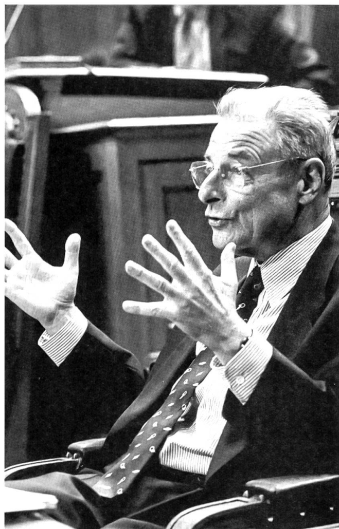
Bundesrat Jean-Pascal Delamuraz tritt zurück Sein letzter parlamentarischer Auftritt im Ständerat.

Bisher erfolglos geblieben ist die langwierige amerikanische Vermittlung zwischen Israel und den Palästinensern. Die Regierung Netanyahu setzt nach wie vor eine expansive jüdische Besiedlungspolitik in den eigentlich den Palästinensern vorbehaltenen Gebieten von Cisjordanien fort und weigert sich, gemäss dem in Oslo mit Arafats PLO geschlossenen Abkommen die israelischen Besatzungstruppen dort weitgehend abzuziehen. Auch weigert sich Israel, den Palästinensern ausser der beschränkten Selbstverwaltung die Errichtung eines selbständigen Staates zu gestatten. Arafats Glaubwürdigkeit im arabischen Lager wird dadurch unterhöhlt, und ein