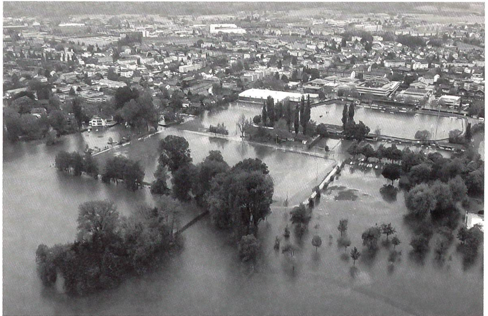
Heftige Regengüsse verursachten zusammen mit der Schneeschmelze im Mai 1999 Überschwemmungen wie hier in Thun.

Aber si het no öpis ufem Härze: «I wett nech no danke, Her Redakter, dass der mer ... gholfe heit. Wüsst der, dihr erinneret mi däre-