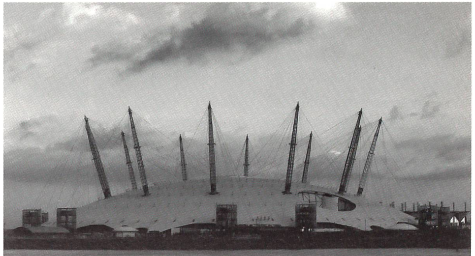
Mit dem Britain-Millennium Dome entstand rund 150 Jahre später ein ähnlich gigantisches Bauwerk in London.

1) Rohstoffe und Erzeugnisse, welche bis jetzt Gegenstände der menschlichen Industrie sind, nach den Naturreichen geordnet; 2) Maschinen für Ackerbau, Fabrik- und Manufakturwesen; 3) Erzeugnisse des Fabrik- und Manufakturwesens; 4) Plastische Kunstwerke. ... Als Ort, an welchem das Ausstellungsgebäude errichtet werden sollte,