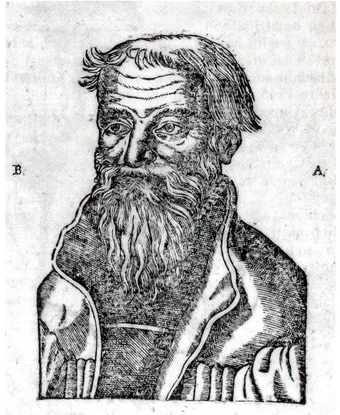
Porträt des Benedicht Aretius im Druck seines Kommentars zur Apostelgeschichte 1607

Benedicht Aretius, der eigentlich Benedicht Marti hiess, wurde zwischen 1522 und 1525 im bernischen Bätterkinden geboren, offenbar unehelich als Sohn eines katholischen Priesters. Er latinisierte später in humanistischer Manier seinen Namen Marti zu Mars nach dem römischen Kriegsgott. Diesen Namen wiederum übersetzte er ins Griechische zu Ares und nannte sich entsprechend Aretius. In