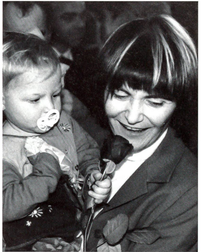
Micheline Calmy-Rey, die erste Grossmutter im Bundesrat

Gleichsam mit Pauken, Trompeten und Fahnen hielt die Schweiz mit einer Hundertschaft offizieller Gäste am 10. September 2002 in New York ihren Einzug als 190. Mitglied der UNO. Harte Knochenarbeit dagegen hatten die Bundesräte Villiger und Leuenberger im Bereich der Aussenbeziehungen zu leisten. Ein monatelanges Hin und Her mit der Europäischen Union gab es in Sachen Wahrung des Bankkundengeheimnisses. Die bundesrätliche Hartnäckigkeit, vorab von Finanzminister Kaspar Villiger , zahlte sich aus. Die existenzielle Gefährdung des Finanzplatzes Schweiz konnte abgewendet werden mit einer Zahlstellen-Steu-