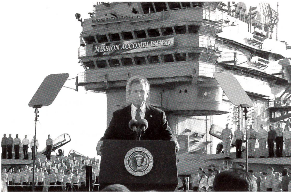
Präsident George W. Bush vor seiner gegen den Irak eingesetzten Militärmacht

fluss die Auffassung, dass Amerika das Mass aller Dinge in der Welt sei und deshalb die Verantwortung für die internationale Ordnung selber zu übernehmen habe. Eine «Pax Americana» sollte inskünftig den Weltfrieden sichern, da dieser auf Grund der konventionellen völkerrechtlichen Grundsätze und der praktisch in internationalen Konflikten oft versagenden UNO nicht zu haben sei.