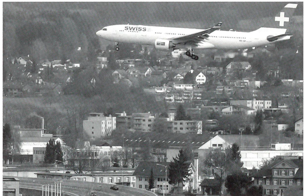
Flughafen Zürich und Fluggesellschaft SWISS im Kampf gegen die Widerwärtigkeiten im internationalen Fluggeschäft

Konjunkturprognosen wurden auch in den wichtigsten Exportländern der Schweiz zurückgenommen. Statt eines anfänglich prognostizierten Wachstums des Bruttonettoproduktes um 0,8 Prozent muss in der Schweiz im Jahr 2003 mit einem Nullwachstum und steigenden Arbeitslosenzahlen (4,2 Prozent) gerechnet werden. Die eidgenössische Staatsrechnung 2002 wies statt eines geringfügigen Budgetdefizits von 300 Mio. einen Fehlbetrag von über 3 Mrd. aus. Die Bundesschulden stiegen auf rund 125 Mrd. Franken. Dieses Ergebnis war nicht nur auf die rückläufigen Steuereinnahmen zurückzuführen. Der gute Abschluss des Jahres 2000 verleitete das Parlament zu einer nachlassenden Ausgabendisziplin, deren Folgen noch jahrelang zu spüren sein werden. Die Ausgabensprünge und die sinkenden Steuereinnahmen zwangen den Bundesrat zu einer drastischen Sanierungsstrategie. Auf der Ausgabenseite ist mit dem «Sanierungspaket 2003» eine Reduktion um 3,5 Mrd. geplant. Da bis 2006 gemäss den Finanzplänen die Einbussen bei den Steuereinnahmen bis zu 5 Mrd. jährlich betragen können, sind weitere Massnahmen in der Grössen-