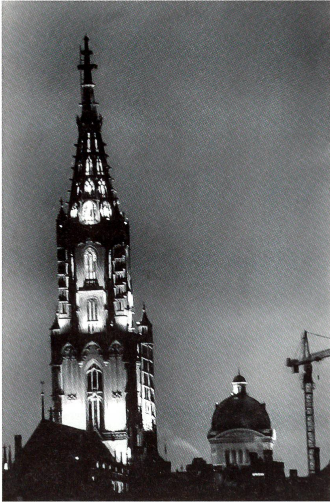
Man traut seinen Augen nicht: das Berner Münster ohne Gerüst

Belper Gemeinderat diesen Plan keineswegs auf; er hat im Mai mit einem Schreiben an die kantonale Baudirektion einem anderen Projekt einer direkten Zufahrtstrasse das Wort geredet. Der Kanton will erst dazu Stellung beziehen, wenn die noch strittige Frage der Pistenverlängerung letztinstanzlich entschieden ist. Inzwischen ist indes an Stelle der bisherigen Baracken am Flughafen ein neues, definitives Abfertigungsgebäude gebaut und im Mai eingeweiht worden. Es wird erwartet, dass die Passagierzahlen, nachdem sie im Jahr 2002 stark rückläufig gewesen waren, fortan dank einer Belebung des Streckennetzes zunehmen werden.