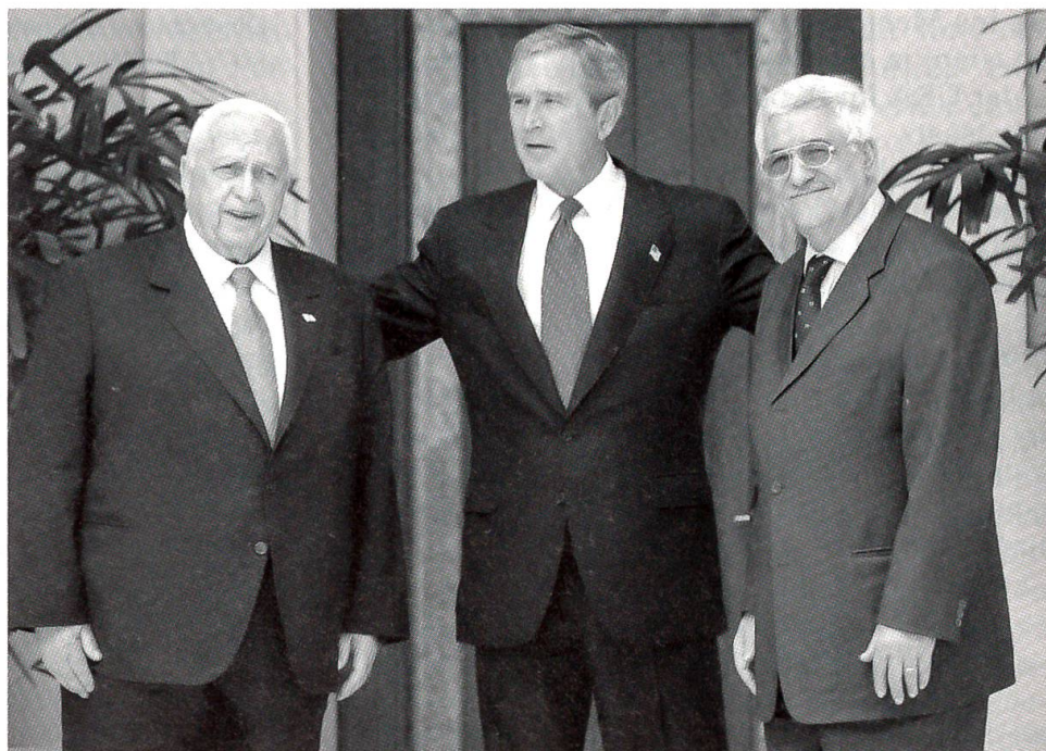
Ariel Sharon (links) und Mahmud Abbas, die Ministerpräsidenten Israels bzw. Palästinas, unternehmen zusammen mit Präsident Bush einen neuen Versuch zur Lösung des Palästinakonfliktes.

nun plötzlich doch auf dem Verhandlungsweg einer Lösung entgegengeführt werden soll. Nach der faktischen Entmachtung von Arafat dank der Einsetzung einer neuen ministeriellen Regierung in Cisjordanien ist den Palästinensern und den Israeli ein mehrstufiger Plan zur Beendigung des endlosen Konflikts ausgehändigt worden, der bis 2005 die Bildung eines unabhängigen Staates Palästina vorsieht. Das palästinensische Kabinett hat dem Plan vollumfänglich zugestimmt, während auf Seiten von Israel Vorbehalte hinsichtlich der geforderten Aufgabe der Errichtung von jüdischen Siedlungen im heute besetzten Gebiet gemacht werden. Das Wunder eines dauerhaften Friedens