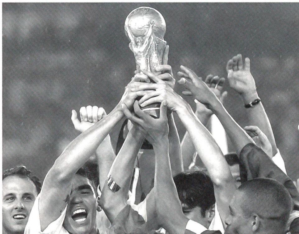
Die Fussballweltmeisterschaft 2002 fand in Japan und Südkorea statt. Brasilien errang dabei den ersten Platz.

Der Kanton Bern trachtet die Zusammenarbeit zwischen den Gemeinden zu fördern und befürwortet auch Bestrebungen des Zusammenschlusses zu grösseren Gemeinden. Nachdem 1973 bereits eine Fusion von Isenfluh mit Lauterbrunnen zu Stande gekommen ist, haben jetzt im März die Gemeinden Englisberg und Zimmerwald ihre Vereinigung zu einer Gemeinde mit dem neuen Namen Wald beschlossen. Im April haben die beiden Gemeinden Ober- und Niederwihtrach im Aaretal ihrerseits einem Zusammenschluss zur neuen Gemeinde Wihtrach zugestimmt. Die Fusion soll am 1. Januar 2004 vollzogen werden. Obschon die Berner Stimmbürger am 24. November einen Kredit von 9,2 Mio. für den Bau einer neuen Zufahrtstrasse zum Flugplatz Belpmoos abgelehnt haben, gibt der