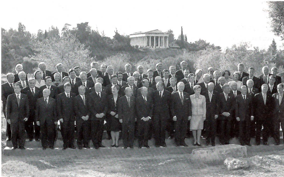
Die Vertreter der bisherigen und der neuen EU-Mitgliedländer in Athen vereint

soll am 1. Mai 2004 erfolgen. Die Regierungschefs der EU-Länder haben am 16. April mit den Vertretern der zehn neuen Mitglieder die Beitrittsverträge in Athen unterzeichnet. Wurden in Kopenhagen die Bedenken und Sorgen über den keineswegs leichten Erweiterungsprozess der EU nur gerade artikuliert, so fehlte eine zuversichtliche Stimmung in Athen vollends, weil im Gefolge der Irak-Krise unerwartet Spannungen nicht nur zwischen mehreren EU-Staaten, sondern auch zwischen solchen und Beitrittskandidaten aufgetreten sind. Diese führen vor Augen, wie problematisch die Harmonie der EU – vor allem im Hinblick auf eine gemeinsame Linie in ausserpolitischen Fragen – offensichtlich noch ist.