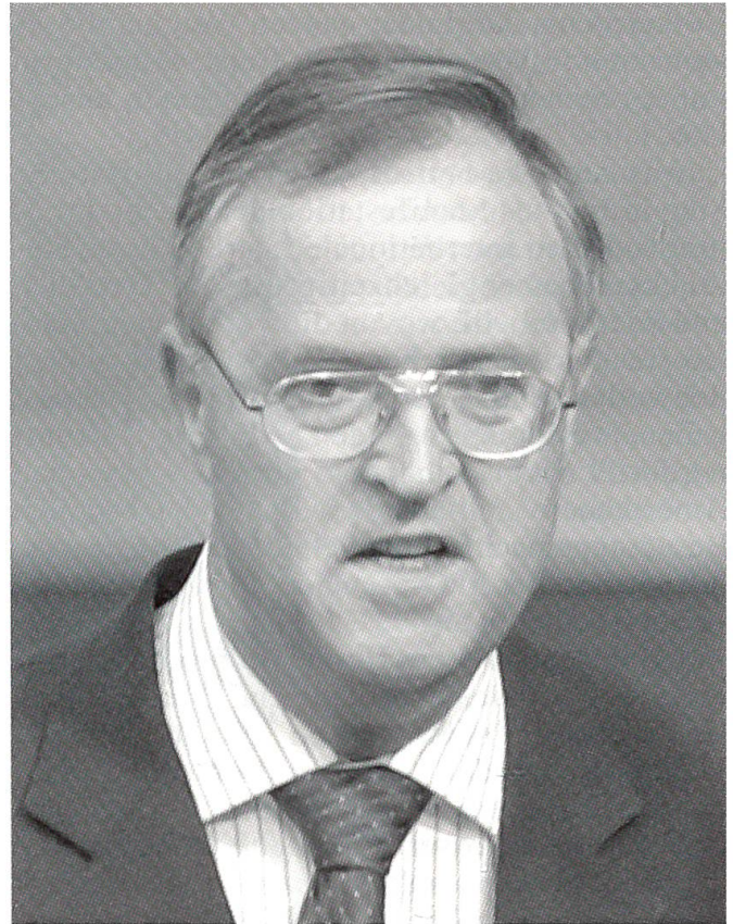
Deutschland in Finanznöten: der gebeutelte Finanzminister Hans Eichel

hat seit einigen Jahren die Spitzenposition in der Rangfolge des Wirtschaftswachstums in Europa eingebüsst. Deutschland liegt – gerade noch vor den jetzt ebenfalls hinkenden Nieder-