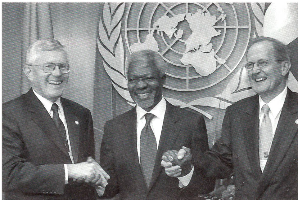
UNO-Beitritt der Schweiz: Bundespräsident Villiger und Bundesrat Deiss mit dem UNO-Generalsekretär Kofi Annan

Das eidgenössische Stimmvolk hiess am 2. Juni 2002 mit 72 Prozent Ja eine Fristenlösung beim Schwangerschaftsabbruch gut und lehnte gleichzeitig eine Initiative der Abtreibungsgegner ab. Am 22. September 2002 wurde die «Goldinitiative» der SVP, die den Ertrag oder den Erlös des für die Währungspolitik nicht mehr benötigten Goldes gänzlich der AHV zuweisen wollte, abgelehnt. Der Gegenvorschlag von Bundes-