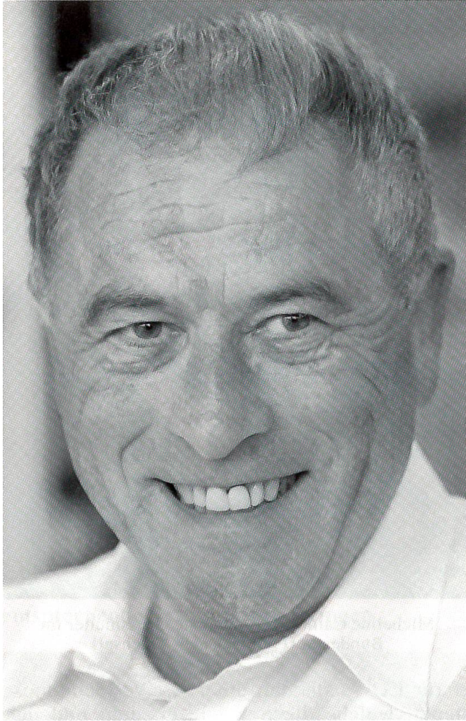
Nobelpreisträger: ETH-Professor und Prionen-Forscher Kurt Wüthrich

reich bei der Bewerbung um die Fussball-Europameisterschaft 2008: Sie findet in diesen beiden Alpenländern statt.