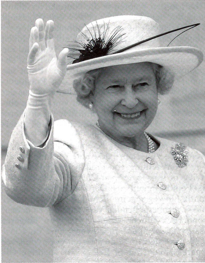
50 Jahre Regentschaft: Königin Elisabeth II.

politische Entscheidungen durchzusetzen, ist das Festhalten an der normativen Rolle der UNO im Völkerrecht mit dem Privileg des Vetorechts im Sicherheitsrat. Auch für