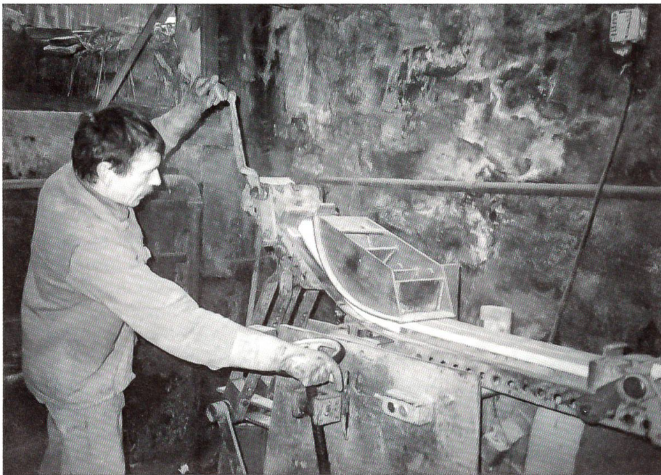
Die Holzkufen werden im erhitztem Zustand gebogen.

Kaum ein Benutzer dieses Wintersportgerätes gibt sich Rechenschaft darüber ab, wie viele Arbeitsgänge für die Herstellung eines Schlittens erforderlich sind. Unsere Schlitten werden aus einheimischem Eschenholz fabriziert. Dieses Holz eignet sich am besten zum Biegen der Kufen. Weil Holz ein lebendiger Werkstoff ist, müssen die beiden Kufen eines Exemplars aus dem gleichen Holzstück geschnitten werden; anders sind keine völlig identischen Biegungen