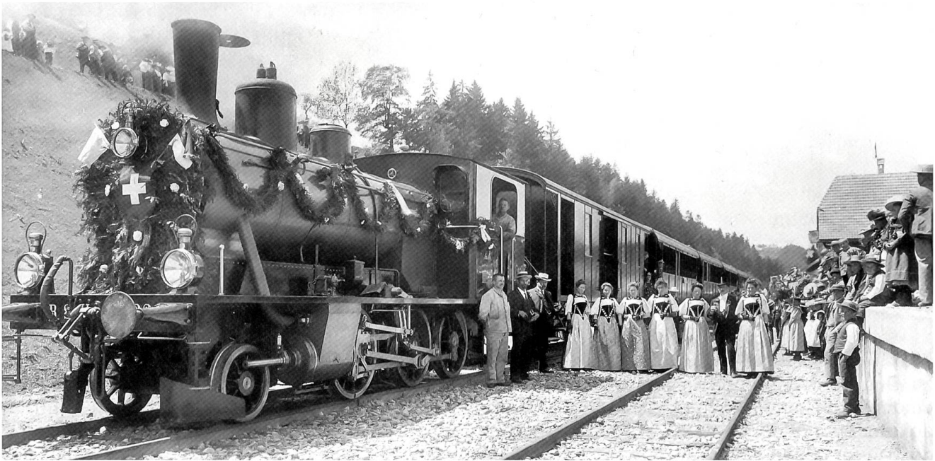
1908 konnte nach langen Querelen die Ramsei-Sumiswald-Huttwil-Bahn eingeweiht werden. Das Bild zeigt den Festzug in Wasen.