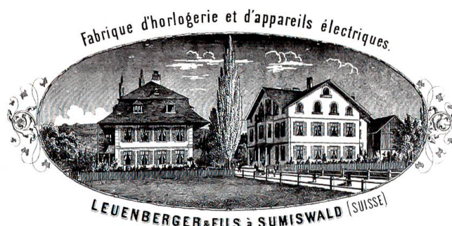
Sumiswald bot Handwerkern früh goldenen Boden: Briefkopf aus den 1870er-Jahren.

Wenn die Gemeinde Sumiswald heute bei offizieller Gelegenheit mit dem Slogan «Fortschritt hat Tradition» auftritt, so hat dies durchaus seine Berechtigung. In den letzten 300 Jahren haben hier nämlich tüchtige und geschickte Handwerker und Unternehmer immer wieder Produkte entwickelt und auf den Markt gebracht, die von Erfindergeist und Innovationsfreude zeugen.