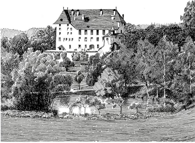
Das Schloss von Südosten, vor der Rekonstruktion des Turmes, im Vordergrund der Spittel-Weiher (Federzeichnung 1945 von Friedrich von Steiger)