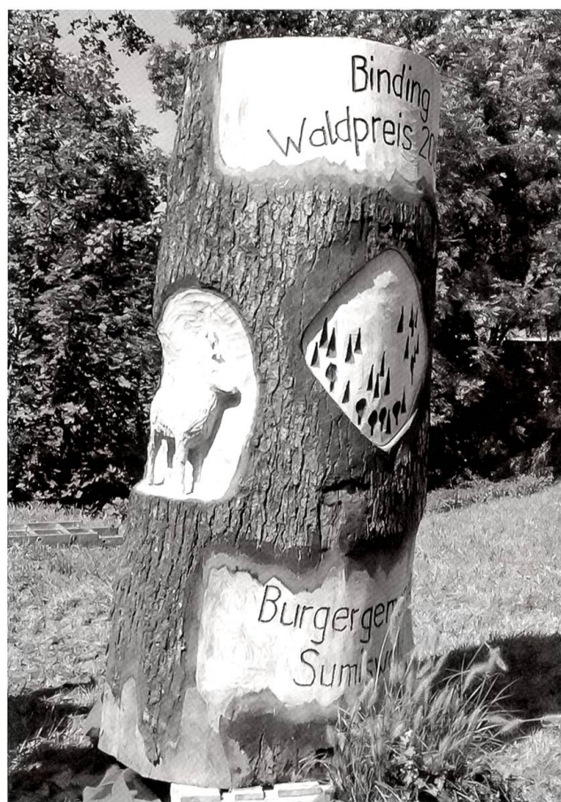
2007 erhielt die Burgergemeinde Sumiswald den Sophie-und-Karl-Binding-Preis als Anerkennung für die jahrelange naturnahe Bewirtschaftung des Waldes.

Im Frühling 2007 wurde die Burgergemeinde Sumiswald mit dem hochdotierten Binding-Waldpreis ausgezeichnet. Diese höchste Auszeichnung der Schweizer Waldwirtschaft erhielt die Burgergemeinde in Anerkennung ihrer jahrzehntelangen naturnahen Waldbewirtschaftung, insbesondere für die sorgfältige Pflege ihrer Plenterwälder und den nicht selbstverständlichen wirtschaftlichen Erfolg ihres Forstbetriebs.