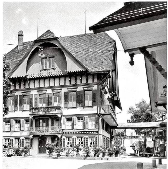
Der Gasthof «Bären», als er neben einem unterirdischen Verbindungsgang noch mit einer Passerelle über der Strasse mit seinen Nebengebäuden verbunden war.

Die Geschehnisse rund um den Bau der RSHB zu Beginn des letzten Jahrhunderts bieten vieles, was einen Roman zum Bestseller machen kann: Rivalitäten, Missgunst, Schlammschlachten, Prozesse. Allein die Auseinandersetzungen um die Frage, wo genau denn nun die Sumiswalder Station zu bauen sei – ob oben auf der Terrasse oder unten im Tal –, ist, jedenfalls mit einem Jahrhundert Abstand betrachtet, eine köstliche Tragikomödie!