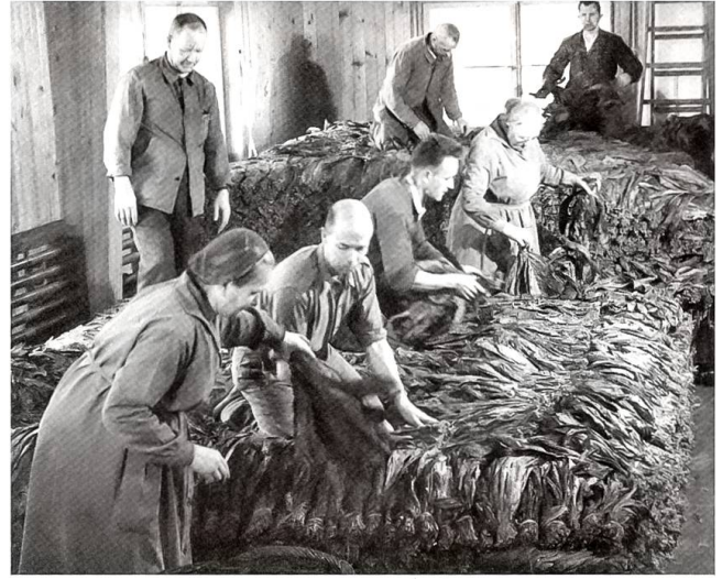
Aus der Tabakfabrik im Wasen: Umschichtung während des Gärungsprozesses

Beginn des 19. Jh. Einige kleine Ausschnitte aus Fetscherins Schilderung der damaligen Verhältnisse lassen erahnen, wie interessant die Lektüre der Sumiswalder «Topographie» ist.