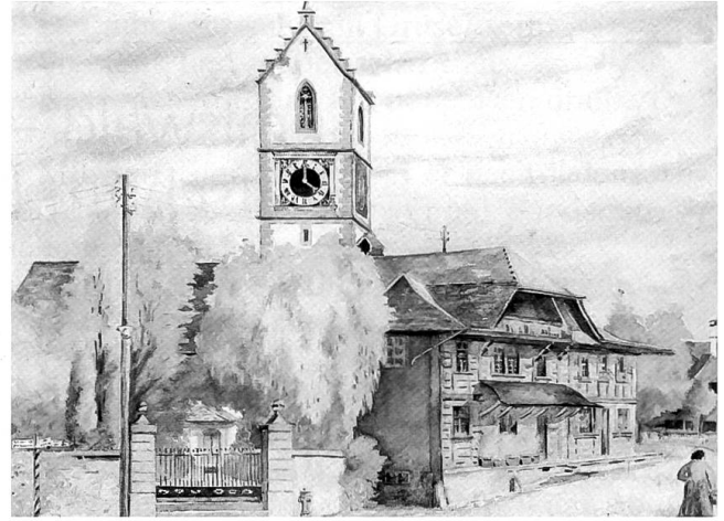
«Beinhaus mit Kirche». Das ehemalige Beinhaus, auf der Darstellung von 1916 als Holz-Ständerbau zu sehen, stammt im Kern aus dem 13./14. Jh. Heute ist es ein Wohn- und Geschäftshaus. (Aquarell von K. Trefzer-Rist, Sammlung: Marianne und Ernst Gerber)

hörten die Edlen von Sumiswald zum ältesten Adel, der sich im neugegründeten Bern niederliess.