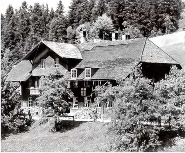
Verstreut über das ganze Gemeindegebiet gibt und gab es «näbenusse» verschiedene Schulhäuser wie dieses hier auf der Schonegg, das 1955 abgebrochen wurde.