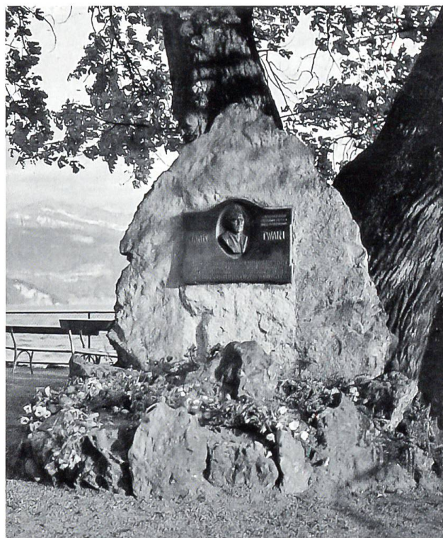
Der Mark-Twain-Gedenkstein in Weggis

Die Sekretariatsarbeit beanspruchte ihn kaum, wenn er dieses Amt überhaupt je ausgeübt hat. Er betätigte sich anfangs lieber als Mann, der zu seinem Vergnügen reist, dann versuchte er sich als Schatzgräber, doch schliesslich zwang ihn schierer Geldmangel zu ernsthafter Arbeit: Anfangs trieb ich mich in der Gegend herum, um nach Silber zu suchen. Als ich jedoch Ende 1862 oder Anfang 1863 von Aurora herkam, um als