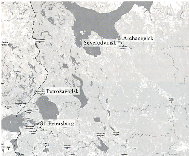
Die Barents-Region mit den Reisezielen der Berichtstatterin