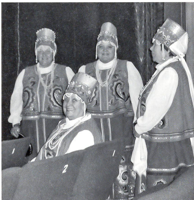
Chorsängerinnen in Archangelsk