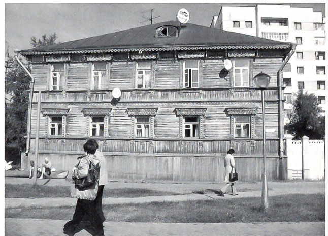
Archangelsk: Alt und Neu in der Fussgängerzone

Archangelsk wurde 1584 von Ivan dem Schrecklichen am Standort eines im 12. Jahrhundert gegründeten Klosters erstellt. Die Hafenstadt an der Mündung der Nördlichen Dvina ins Weisse Meer hat knapp 400 000 Einwohner. Die meisten Arbeitsplätze finden sich in der Holzbearbeitung, der Papier- und Zelluloseherstellung. Dem Holzhandel und dem Holzexport dient der über den Winter mit Eisbrechern offen gehaltene grösste Hafen im Norden.