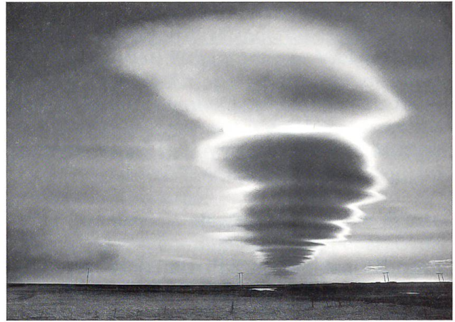
Ein Vulkanausbruch in Island legt Europas Luftfahrt lahm.

geschwindigkeit wurden in den Pyrenäen 238 km/h gemessen. Insgesamt fielen dem Orkan 65 Menschen zum Opfer. Am meisten Leute kamen in den französischen Atlantikdepartementen Vendée und Charente-Maritime um. Einige Ortschaften wurden überflutet, nachdem die Deiche brachen. Allein aus Frankreich wurden 53 Todesopfer gemeldet.