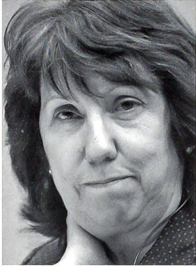
Die Britin Catherine Ashton, Aussenministerin Europas

Das Parlament der Europäischen Union wurde am 7. Juni neu bestellt. Dabei haben die Bürgerlichen ihre Vormachtstellung ausgebaut. Schlappen erlitten die deutschen und österreichischen Sozialdemokraten, die französischen Sozialisten und die englischen Labours. Interessant ist, dass die Wahlbeteiligung weiterhin sank, obschon das Europäische Parlament immer weiter gehende Kompetenzen erhält.