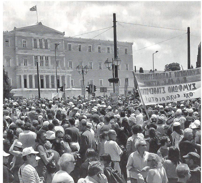
Athen: Streik gegen die Sparmassnahmen der Regierung

Bei den Parlamentswahlen im Oktober eringt die PASOK (Panhellenische Sozialistische Bewegung) einen triumphalen Sieg. Neuer Ministerpräsident wird der 57-jährige Giorgos Papandreou. Das Land befindet sich in grossen finanziellen Schwierigkeiten, und die Regierung muss kurz nach Antritt drastische Sparmassnahmen vornehmen, die wiederum zu vielen Protesten und Ausschreitungen führen. Angesichts der horrenden Staatsschulden und der erneuten Neuverschuldung 2009 von über 13% muss die Regierung Ende April die Hilfe der übrigen Euroländer und des IMF offiziell anfordern, was mit noch strengeren Sparmassnahmen verbunden sein wird.