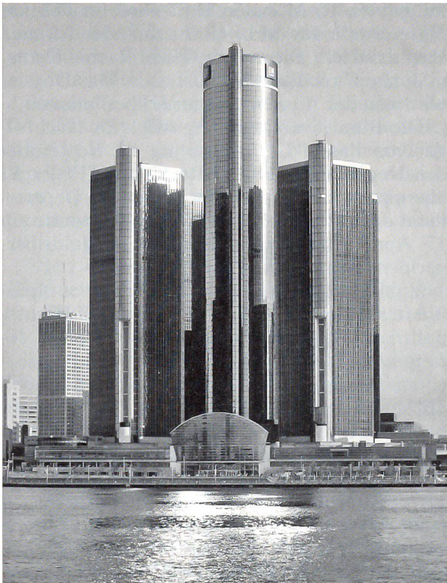
General Motors wird Opfer der Wirtschaftskrise.

Aus der globalen Wirtschaftskrise sei, neben anderen unzähligen Opfern, das Beispiel von GM, General Motors Corporation, mit Sitz in