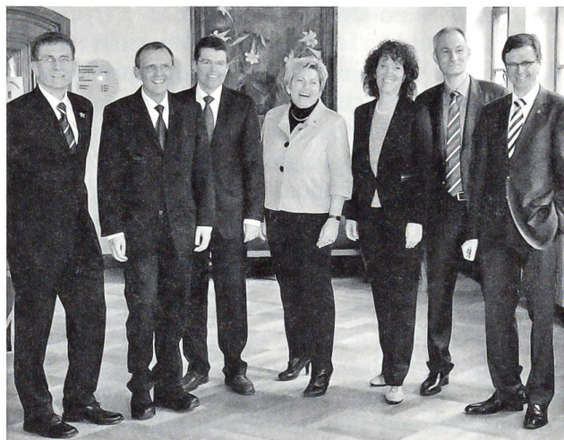
Der Berner Regierungsrat mit zweiter Dame.