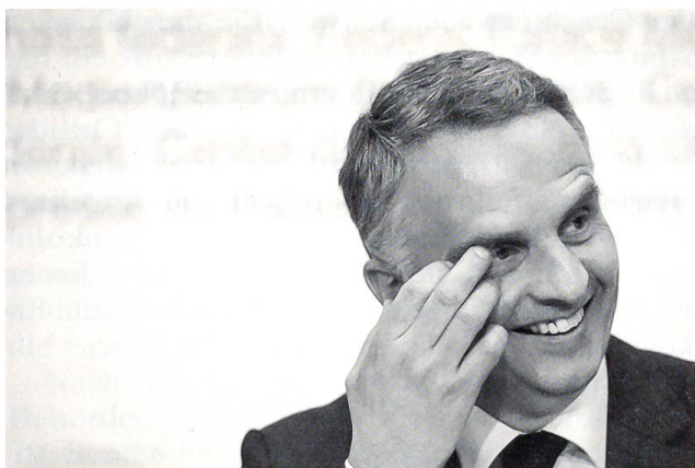
Didier Burkhalter, seit 16. September 2009 neuer Bundesrat

Am 27. September kamen wiederum zwei Vorlagen zur Volksabstimmung, und wie im Mai war eine der Vorlagen stark umstritten. Dabei ging es um die auf sieben Jahre befristete Anhebung des Normalsteuersatzes der Mehrwertsteuer um 0,4% als Zusatzfinanzierung, um die Schulden der Invalidenversicherung (IV) abzubauen. Gleichzeitig wurde die Verkopplung von AHV und IV aufgehoben. Damit ist in Zukunft die AHV nicht mehr für Schulden der IV zuständig. Die Vorlage wurde schliesslich mit 54,5% Ja- gegen 45,5% Neinstimmen akzeptiert. Die Stände mussten ebenfalls zustimmen, und das ging mit 12:11 sehr knapp aus. Der neue Normalsteuersatz der MWST wird ab 2011 auf 8% zu stehen kommen.