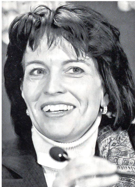
Doris Leuthard, Bundespräsidentin für das Jahr 2010

Neben vielen anderen Winterstürmen sei hier der Orkan «Xynthia» erwähnt. Vom 26. bis 28. Februar wütete er von der Iberischen Halbinsel über Frankreich, die Beneluxstaaten, Deutschland bis Südschweden. Am stärksten traf es den Norden Portugals, Galizien, das Baskenland, die französische Atlantikküste sowie Teile Deutschlands. Als höchste Wind-