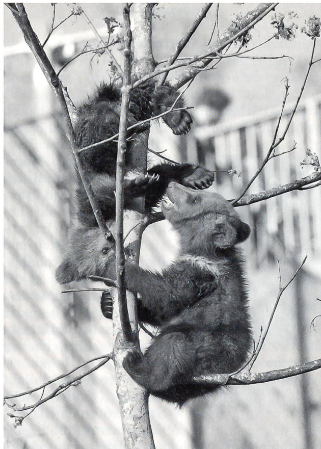
Der neue Bärenpark und seine Bewohner üben eine gewaltige Anziehungskraft aus.

Am 25. Oktober wird Berns neuer Bärenpark eröffnet. Die Bären, Wappentier, Werbe- und Sympathieträger der Stadt, sollen es im neuen, tiergerechten Park besser haben als im mehr als 150 Jahre alten Bärengaben (seit 1857). Künftig sollen die Tiere im Park oberhalb der Nydeggbrücke, der mit der bisherigen Anlage verbunden ist, wie echte Bären leben können – klettern, graben und nach Fischen jagen. Die