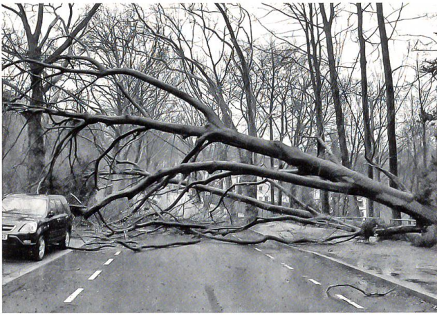
Orkan Xynthia richtet in Europa grosse Schäden an.