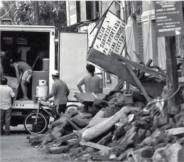
Arge Verwüstungen durch Erdbeben in Haiti und Chile

sollen über 40 Mio. US-Amerikaner in den Genuss einer Krankenversicherung gelangen, von der sie bisher ausgeschlossen waren.