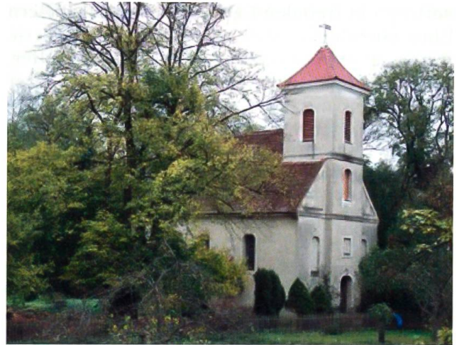
Die Friedensreich-Kirche, die älteste Kirche der Stadt Potsdam überhaupt, Zeugnis und Denkmal der Einwanderung von Berner Familien um 1690

Nachdem den Inspektoren Nachbesserung versprochen worden war, reisten sie mit einem solches bestätigenden Schreiben des Kurfürsten im November 1684 zurück nach Bern.