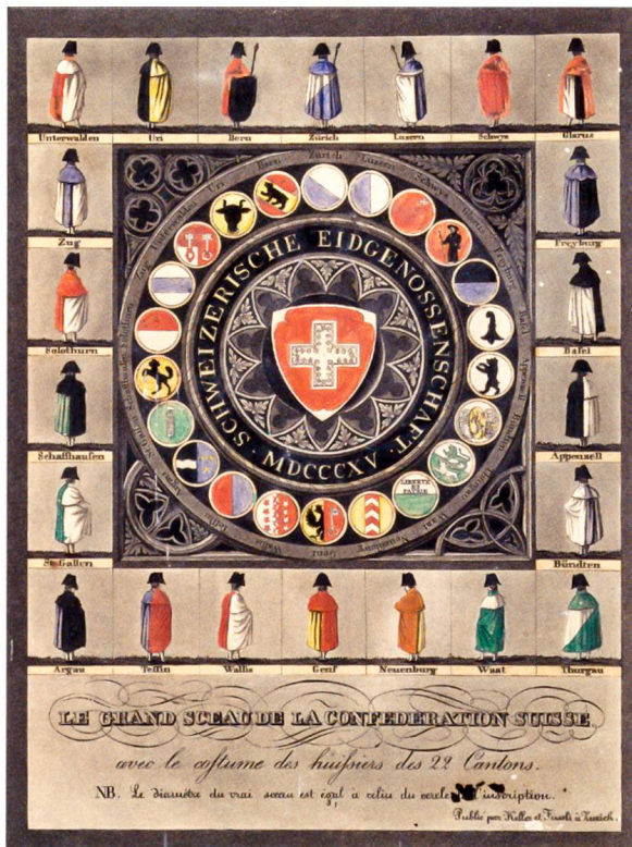
Grosses Siegel der Eidgenossenschaft nach 1815 mit den Amtstrachten der 22 Kantonsweibel

be, Strassen- und Wasserbauten dienten der Arbeitsbeschaffung. Schützen- und Turnvereine brachten Dynamik und Vitalität, unter der starren Oberfläche bereitete sich die Regeneration vor.