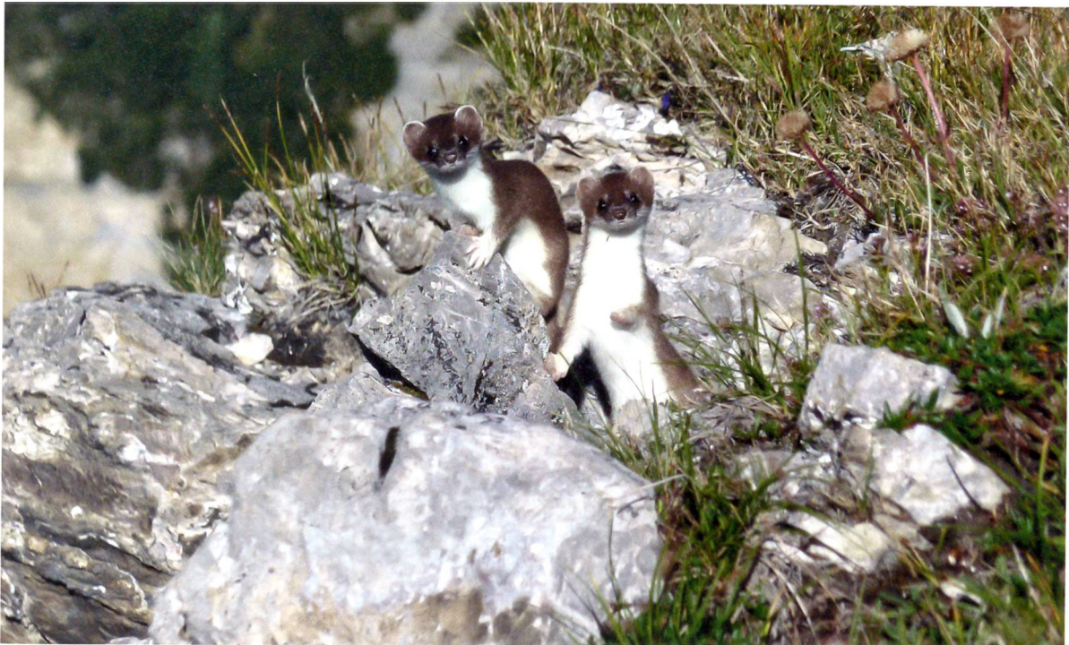
Das Hermelin oder Grosswiesel ist auf der Körperoberseite braun, an Kehle und Bauch weiss gefärbt. Es lebt territorial, verteidigt im Streifgebiet aber nur das Nest.