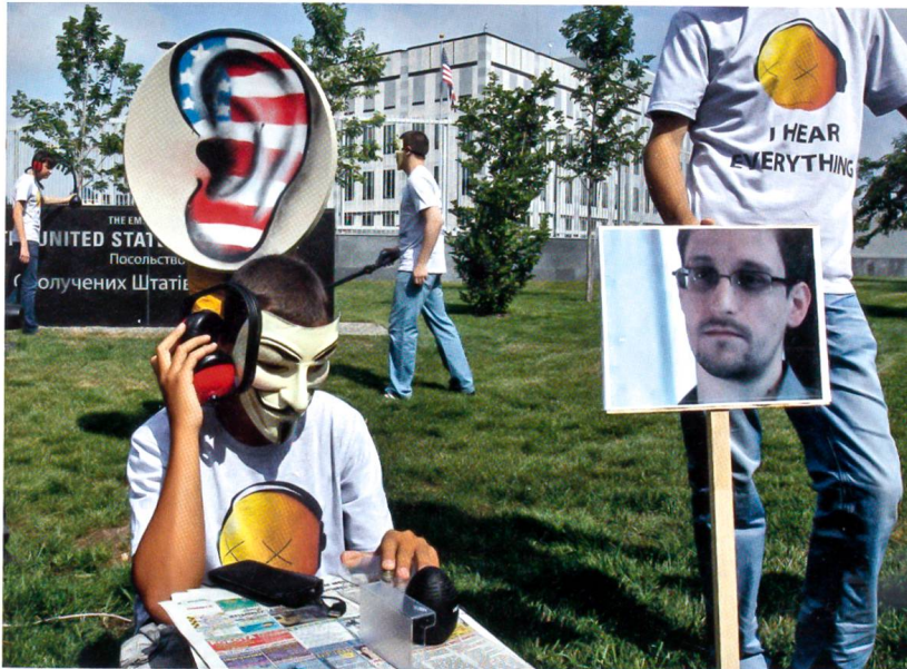
Das globale Überwachungsprogramm der NSA wird aufgedeckt. Ukrainische Aktivisten demonstrieren vor der US-Botschaft in Kiew.

kündigt Neuwahlen an. Während die Armee und viele liberal gesinnte Protestierende von der Verhinderung einer islamistischen Diktatur reden, erkennt der Westen eher einen Militärputsch, der den arabischen Frühling infrage stellt. Bald setzt die Verfolgung der Muslimbrüder ein, die zur terroristischen Gruppierung erklärt werden. In einem repressiv werdenden Klima lässt sich al-Sisi zum Präsidentschaftskandidaten aufbauen.