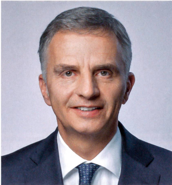
Didier Burkhalter, Bundespräsident für das Jahr 2014