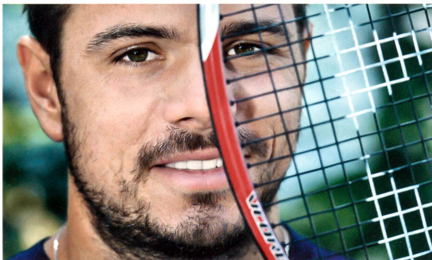
Stanislas Wawrinka ist «Schweizer des Jahres» 2013.

8. November: Der Schweizer Tennisspieler Stanislas Wawrinka zieht an den World Finals in London in den Halbfinal ein und ist dort erstmals vor der ewigen Nummer 1 der Schweiz, Roger Federer, klassiert.