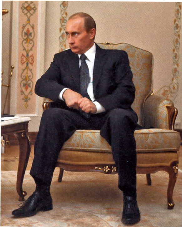
Wladimir Putin betreibt forsche Machtpolitik.