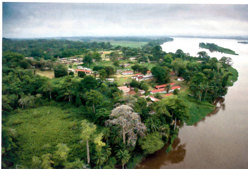
Lambarene (Gabun), die Wirkungsstätte Albert Schweitzers

Zur Untätigkeit verurteilt, befasste sich Albert Schweitzer ab 1914 zeitlebens sehr stark mit der Frage des Niedergangs der Menschheitskul-