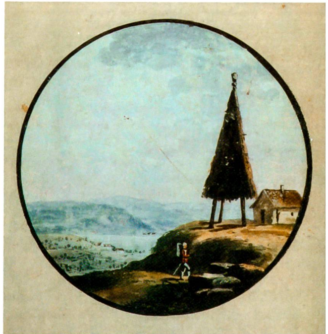
Wachtfeuer bei Nidau, zeitgenössische Darstellung

Und kurz bevor sich im März 1798 das Alte Bern von den Franzosen unter Napoleon Bonaparte am Grauholz endgültig geschlagen geben musste, wurden auch da die Soldaten – ein letztes Mal – mittels der Wachtfeuer zum Einsatz gerufen: Als General Ludwig von Erlach am 1. März 1798 die Feuer entfachen lassen wollte, missfiel das dem Kriegsrat noch. Sie wurden erst in der Nacht vom 4. auf den 5. März angezündet, als die Franzosen bereits an der Sense standen. In seiner Erzählung