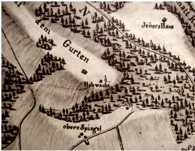
Die Hochwacht auf dem Gurten, 850 m ü. M., dargestellt auf dem nach Süden orientierten «Plan der Kirchgemeinde Köniz» von Caspar Fisch aus dem Jahr 1810

geln mit weitem Ausblick, meist auf Höhen zwischen 500 und 1000 Metern über Meer. Orte von über 1500 Metern wurden gemieden, da sie zu abgelegen sind und oft von Nebel und Wolken umhüllt.