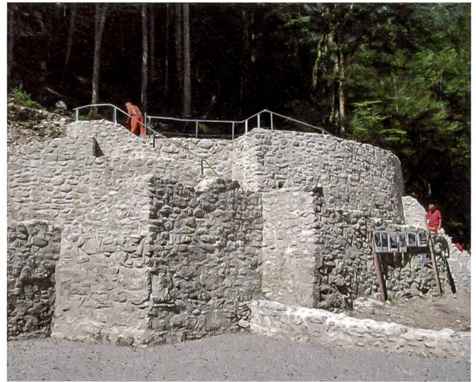
Sanierungsarbeiten am hinteren Weissenburgbad im Sommer 2015

Auf ähnliche Weise wird der Nachmittag zugebracht. Von zarter Jungfrauen Hand, welche eben Kräfte besitzt einen Knäuel zu winden, werden Kegel geschoben und schwere Kugeln