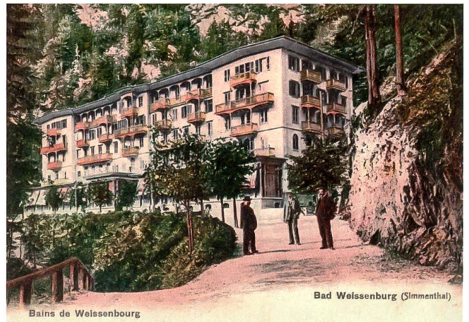
Das vordere Bad auf einer zeitgenössischen Karte

Nicht weit vom hinteren Bad entfernt lag das vordere. Dieses wurde Mitte des 19. Jh. als Ergänzung zum hinteren errichtet und nach