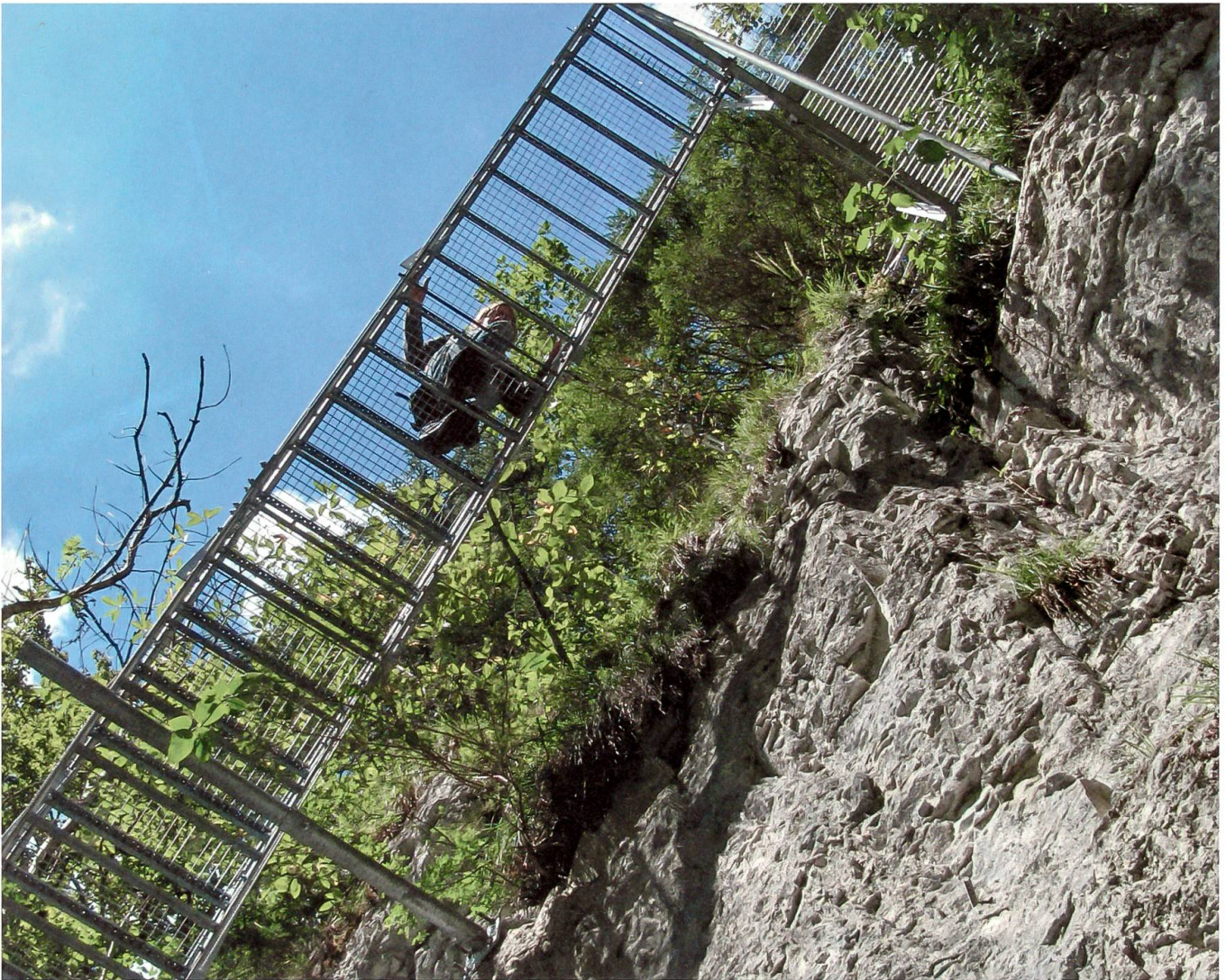
Metalltreppen ersetzen die Leitern von einst.

senburg, welchem wir auf unserer Wanderung in Form von Zeitzeugen am Wegrand bald begegnen werden. Vorher aber führt uns der Weg noch über die drei währschaften Morgete-Alpen – Obriste, Mittliste und Undriste –, und wir passieren den Wasserfall, der von hoch herab über eine Felsstufe fällt. In mehreren Kehren geht es weiter talwärts, stets dem Morgetebach entlang bis hinunter zur Sagi, wo man die Bachseite wechselt. Nun ist es nur noch ein Katzensprung bis zu einem nächsten Höhepunkt unserer Tour: Über die im Oktober 2013 eröffnete, 111 Meter lange Hängebrücke schweben wir ebensolche 111 Meter über Grund und