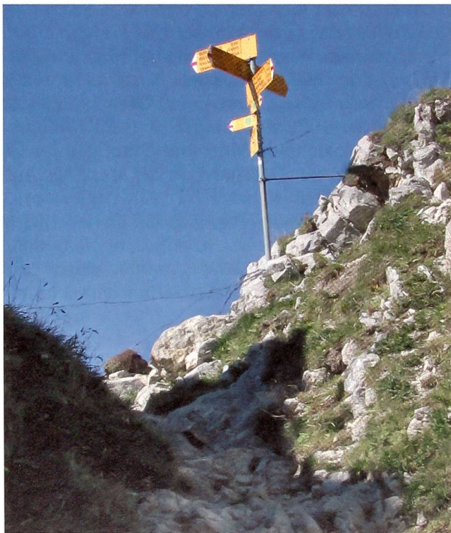
Morgetepass, 1959 m ü. M.

Ziemlich genau in der Mitte liegt er, auf dem Weg aus dem Gantrischgebiet im Berner Mittelland hinüber ins Simmental im Berner Oberland, auf der Gemeindegrenze zwischen Guggisberg und Oberwil i.S., auf einer Höhe von knapp unter 2000 Metern über Meer: der Morgetepass. Und als solcher liegt er auch fast genau in der Mitte zwischen dem ehemaligen mächtigen Gurnigelbad und den ehemaligen grossen Weissenburgbädern, dem hinteren und dem vorderen. An die vier Stunden beträgt der Weg zu Fuss sowohl vom einen wie vom andern ehemaligen Heilbad hinauf zum Passübergang. Komfortabel bringt der öffentliche Ver-