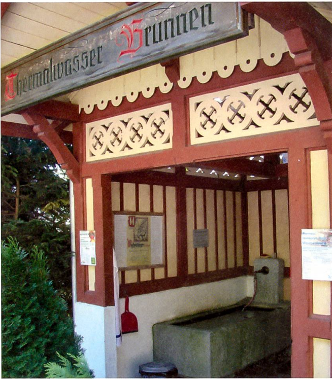
Quellfrisches Kurwasser am Bahnhof Weissenburg

einem Vollbrand 1898 in kurzer Zeit neu und grösser wieder aufgebaut. Es überstand die bewegte Bäderzeit bis ins Jahr 1963, dann stand es leer, verlotterte, brannte 1974 erneut ab. Auch von ihm sind noch einzelne, wenn auch wenige Zeitzeugen sichtbar, wie etwa der elegante Musikpavillon oder ein kleiner Teil der einstigen grossen Hotelküche. Dass hier einst sogar Tennis gespielt wurde, ist einerseits