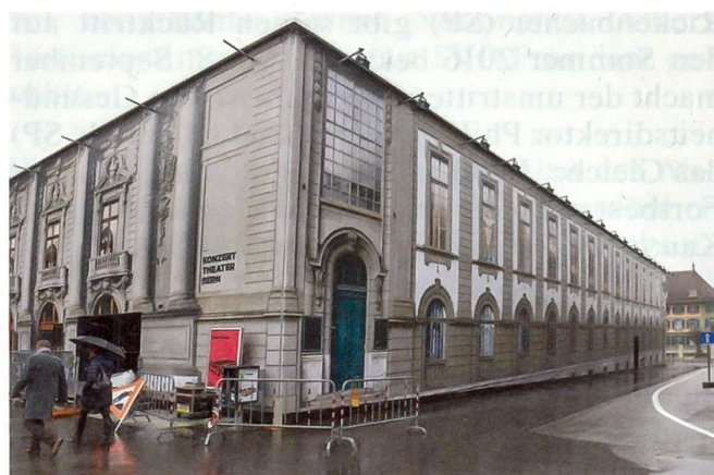
Kubus auf dem Waisenhausplatz, wo während der Sanierung des Stadttheaters gespielt wird

19. März: Mit einem Fest eröffnet Konzert Theater Bern einen provisorischen Kubus auf dem Waisenhausplatz, in dem während der Sanierung des Stadttheaters gespielt wird.