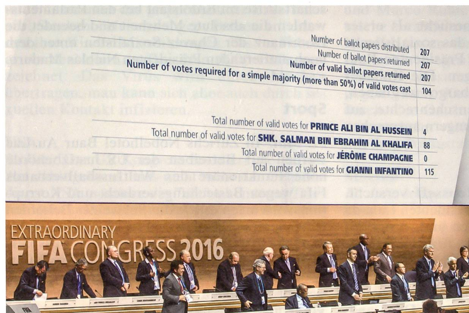
Wahl von Gianni Infantino zum neuen Präsidenten der arg gebeutelten FIFA

9. Oktober: Nach einem 7:0 gegen San Marino und dank der Niederlage des direkten Konkurrenten Slowenien qualifiziert sich die Schweizer Fussballnationalmannschaft vorzeitig für die Euro 2016 in Frankreich.