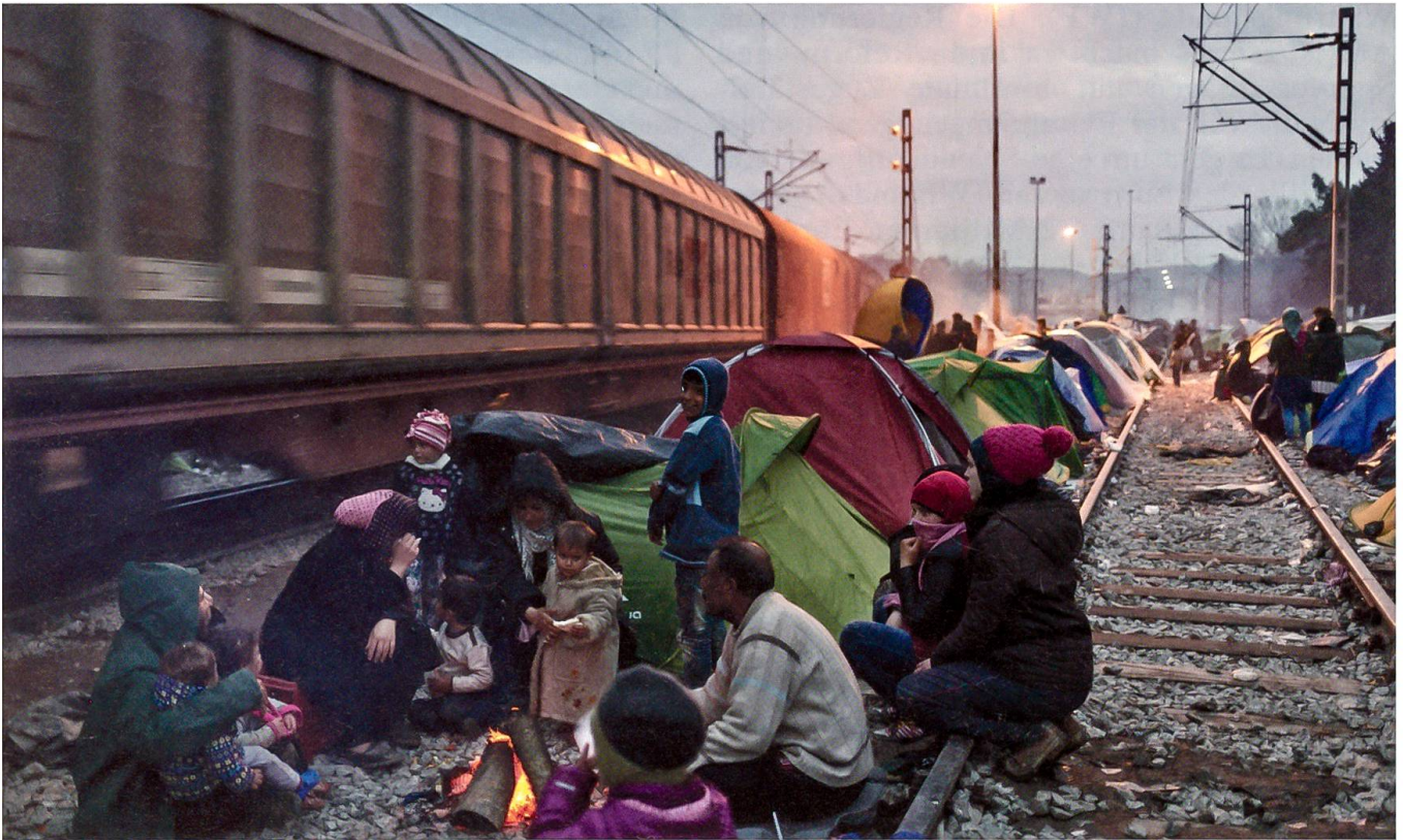
Bilder wie dieses machten zeitweise täglich auf das Flüchtlingselend aufmerksam.

nisterpräsident Matteo Renzi vorangetriebene Reformpaket gegen die trägen Politinstitutionen Italiens stimmen 179 Senatoren bei 16 Gegenstimmen und 7 Enthaltungen. Zahlreiche Senatoren der Opposition verlassen vor der Abstimmung den Saal.