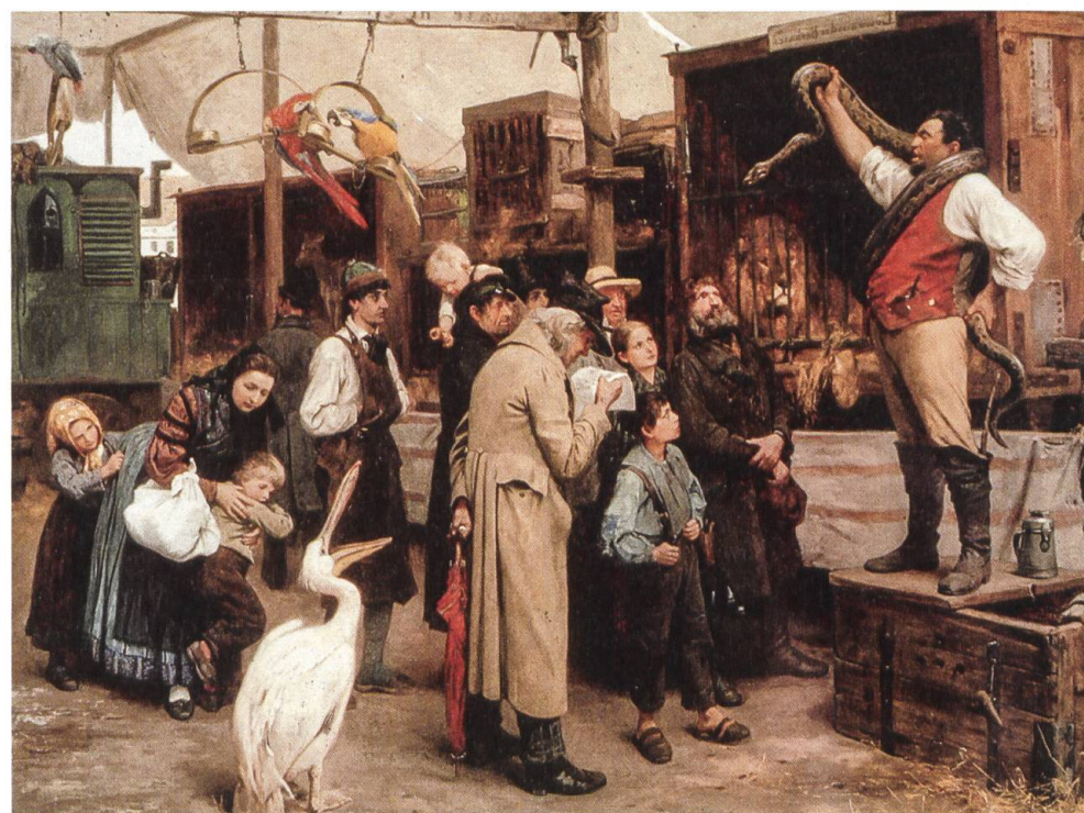
Die alten Menagerien (hier ein Gemälde von 1864) waren, im Gegensatz zu den grossen Tiergehegen des Altertums, spartanisch klein und mit engen Gitterkäfigen.

In neuerer Zeit und nachdem die Durststrecke der Kriegszeit überstanden war, änderte sich die Situation für die zoologischen Gärten gewaltig. Unter dem Druck zunehmender Naturbedrängnis und steigenden Umweltverständnis