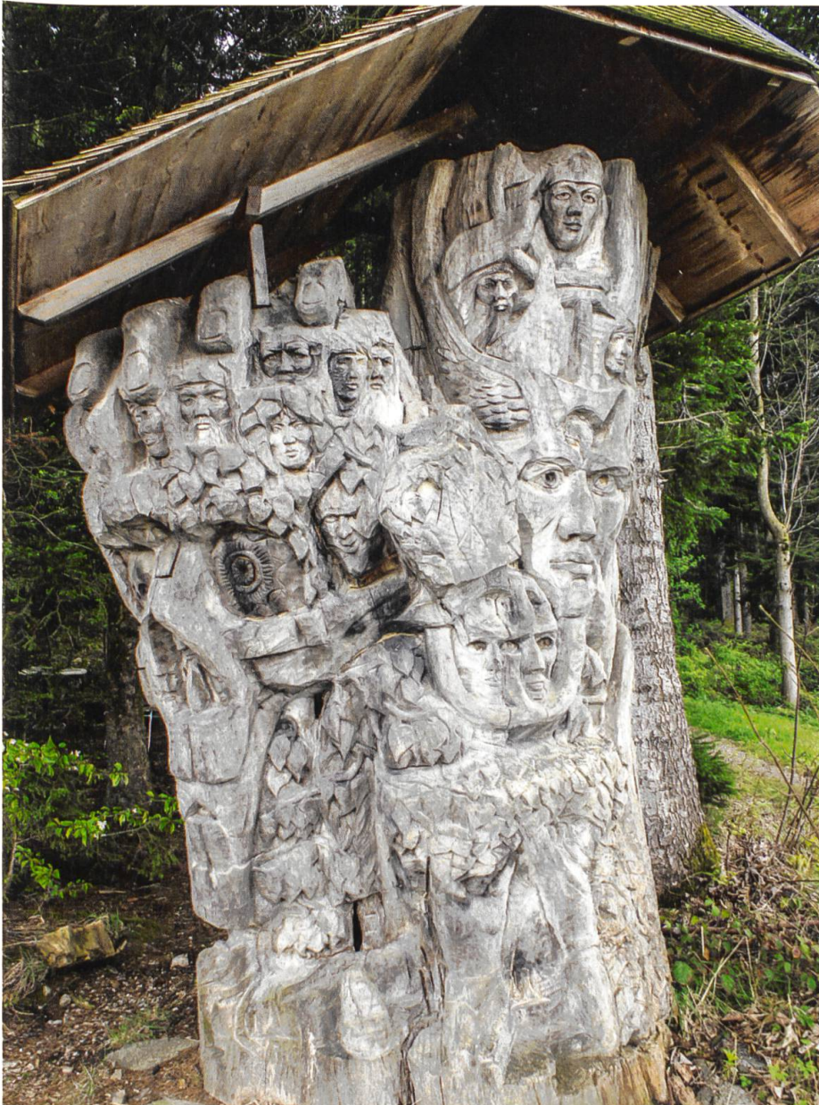
«Aspi-Linde». Kunstinstallation von Urs P. Twellmann