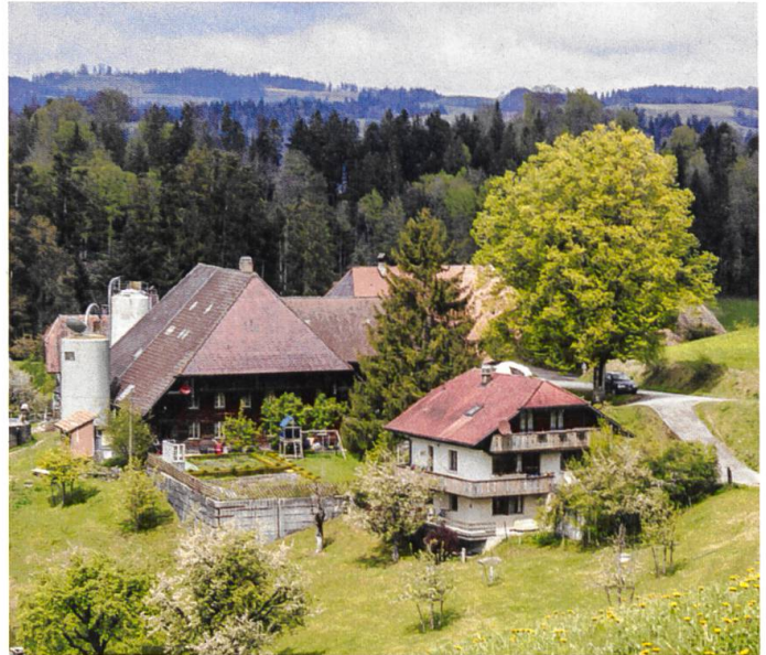
Linden bei Bauernhöfen als Schattenspender