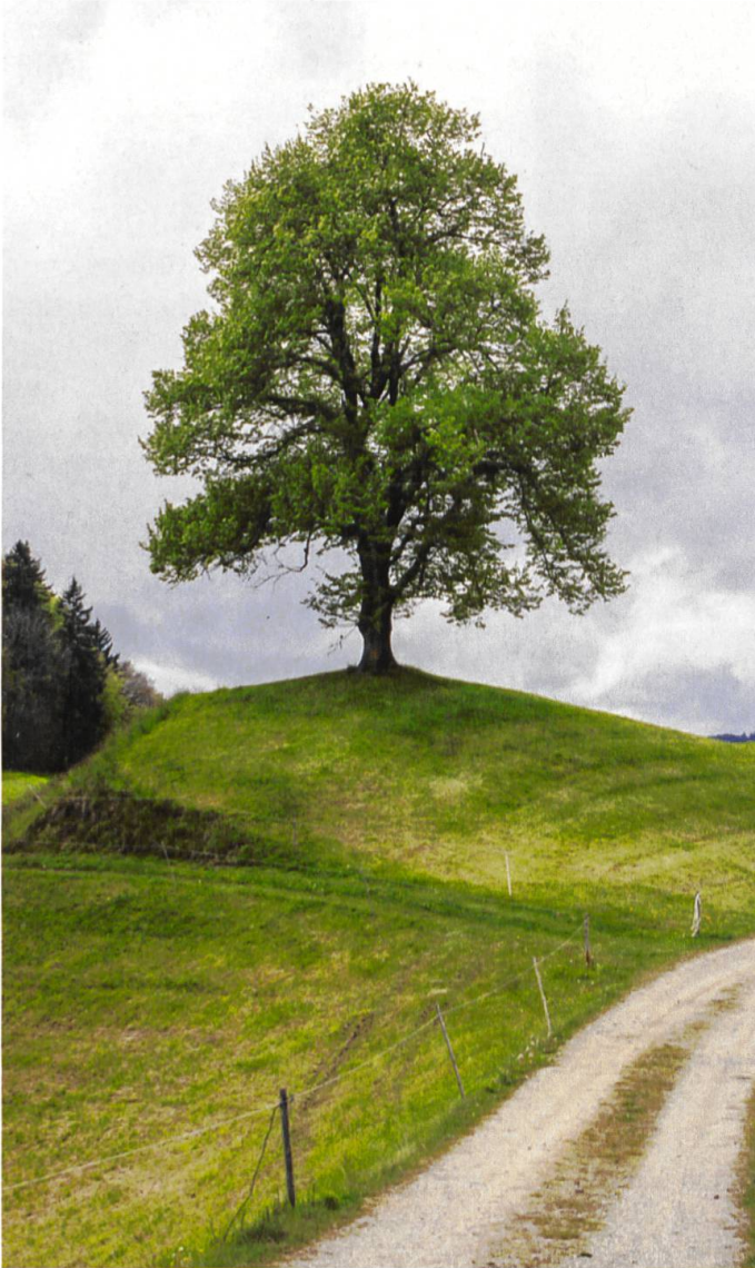
Linden auf zahlreichen Hügeln als geografische Leitpunkte