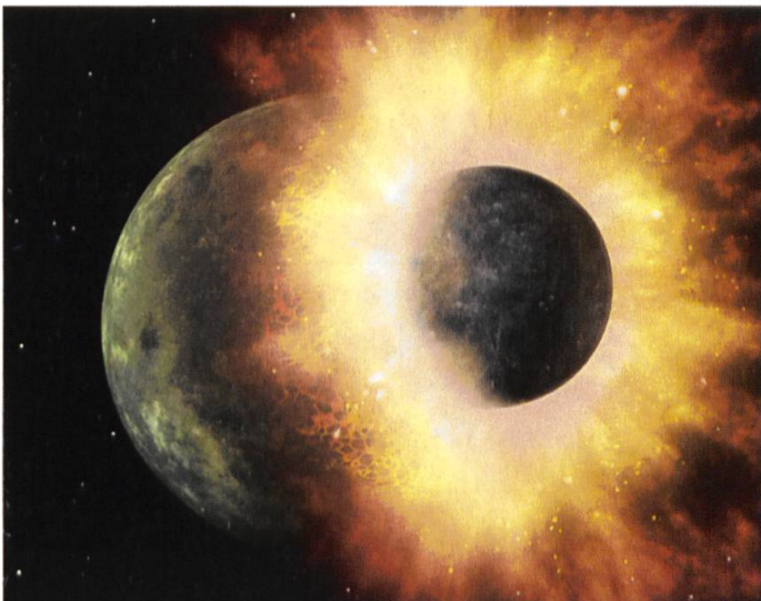
Künstlerische Darstellung eines Einschlages auf einen jungen Planeten. Zeichnung NASA/JPL-Caltech

Kein anderer Planet als die Erde hat im Verhältnis zur eigenen Grösse einen solch grossen Mond. Weitere, ähnlich grosse und sogar grössere Monde als der unsere kreisen zum Beispiel um die Planeten Jupiter oder Saturn. Doch sind diese beiden rund zehnmal grösser als die Erde! Warum also hat die Erde als einziger Planet im Sonnensystem einen solch grossen Mond? Ja, wir Menschen sind neugierig! Die Frage nach dem Warum lässt uns oft keine Ruhe. So lange, bis die Frage beantwortet ist.