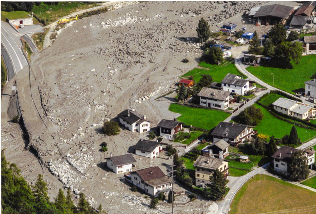
Bergsturz Bondo Bergell im August und September