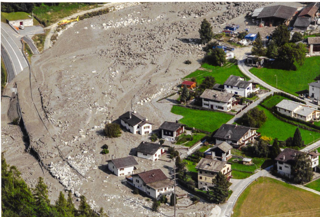
Bergsturz Bondo Bergell im August und September