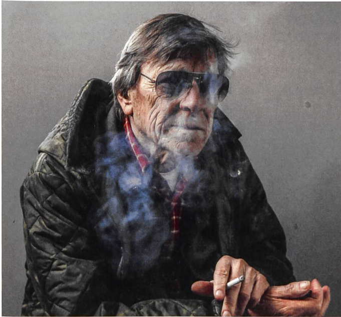
Polo Hofer stirbt am 22. Juli 2017 im Alter von 72 Jahren

5. Dezember: Das Internationale Olympische Komitee (IOC) suspendiert Russland wegen seiner Dopingpraktiken von den Olympischen Winterspielen 2018 in Südkorea. Saubere russische Athleten dürfen aber unter neutraler Flagge teilnehmen.