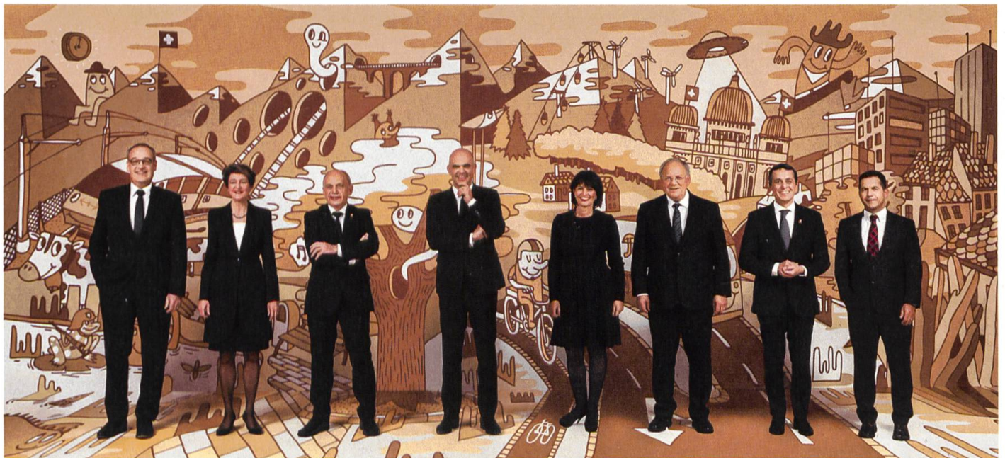
Bundesratsfoto mit Präsident Alain Berset

24. September: Bundesrat Alain Berset's Rentenreform wird von den Schweizer Stimmberechtigten mit 52,7% Nein-Stimmen abgelehnt. Die Reform hätte unter anderem eine AHV-Rentenaufstockung um 70 Franken im