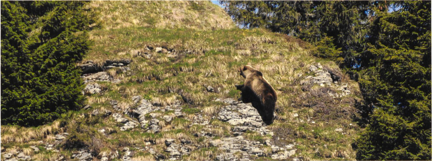
Das Berner Wappentier taucht wieder im Kanton auf, und zwar im Eriz (zvg/Jagdinspektorat Kanton Bern).

Leichen einer Frau und eines Mannes gefunden. Der DNA-Test belegt, dass es sich um ein seit 1942 vermisstes Paar aus Savièse VS handelt. Die noch lebende Tochter ist erleichtert. Endlich können ihre Eltern bestattet werden.