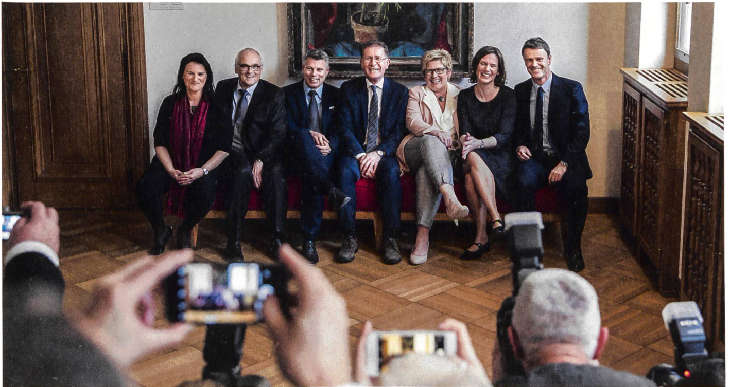
Der am 25. März neu gewählte Regierungsrat