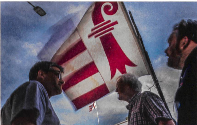
Abstimmung Kantonswechsel Moutier vom 18. Juni 2017

18. Juni: Denkbar knapp, mit 51,7% Ja-Stimmen und 137 Stimmen Vorsprung, gewinnt das separatistische Lager die Gemeindeabstimmung über die künftige Kantonszugehörigkeit des gespaltenen Jurastädtchens Moutier. Es wird vom Kanton Bern zum Kanton Jura wechseln. Die französischsprachige Minderheit im Berner Jura wird dadurch verkleinert. Zahl-