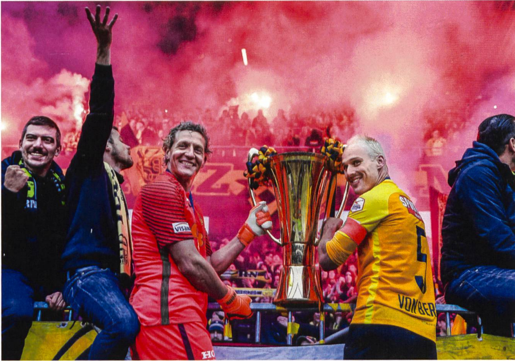
Schweizer Meister Young Boys Bern

7. Oktober: Die Schweizer Fussball-Nationalmannschaft schlägt in einem begeisternden Spiel für die WM-Qualifikation in Basel Ungarn mit 5:2. Sie hat bisher alle ihre Qualifikationsspiele gewonnen. Am 12. Oktober verliert sie aber das entscheidende und letzte Spiel gegen den amtierenden Europameister Portugal in Lissabon mit 0:2. Das Schweizer Team muss in die Barrage.