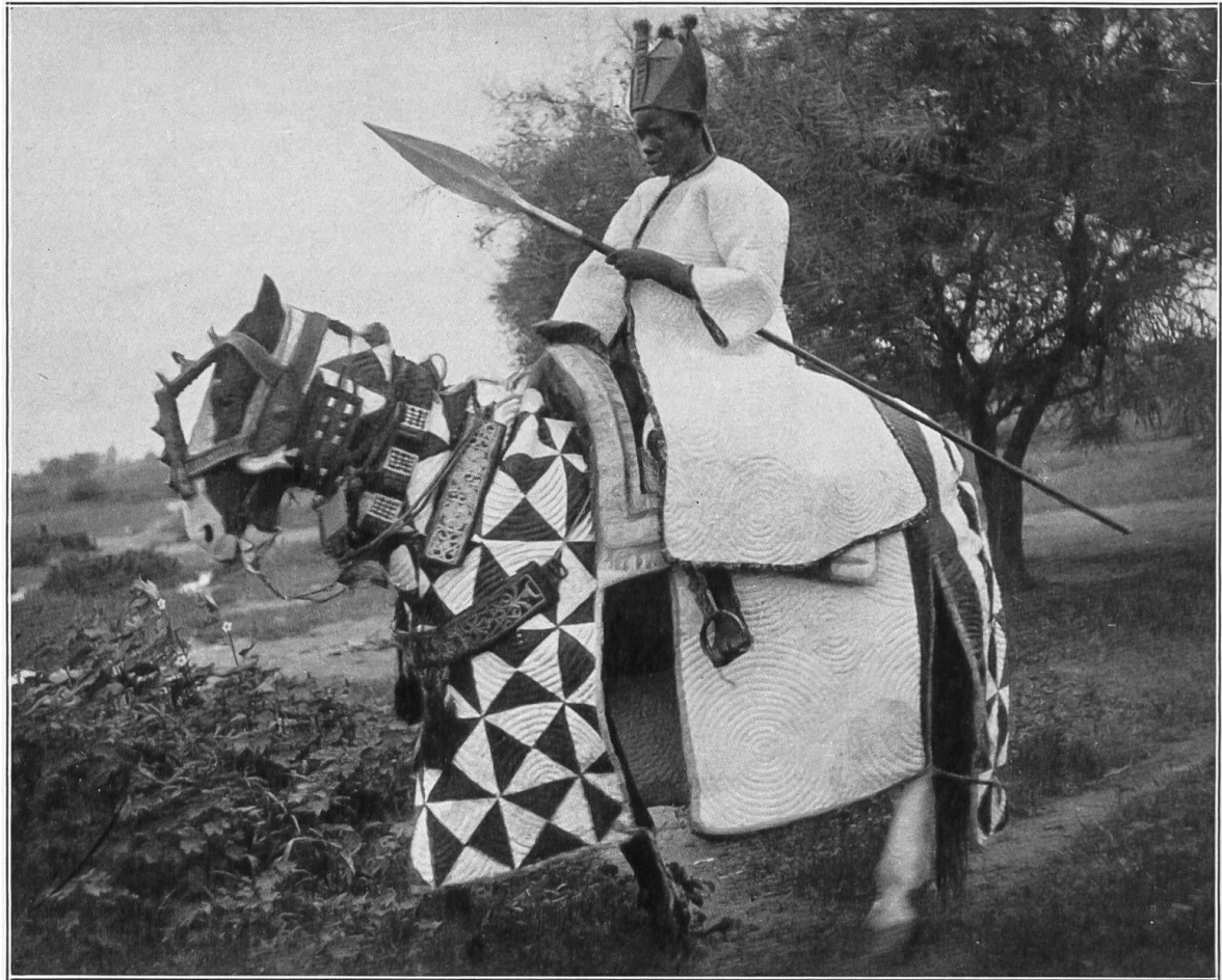
F. A. Franks, phot. Kano 1919.

Wattepanzer eines Gardereiters des Sultans von Bornu aus Maidugeri (Nord-Nigeria) in der Ethnographischen Abteilung des Bernischen histor. Museums.