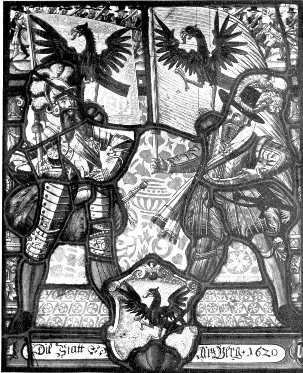
Stadtscheibe von Aarberg. 1620.