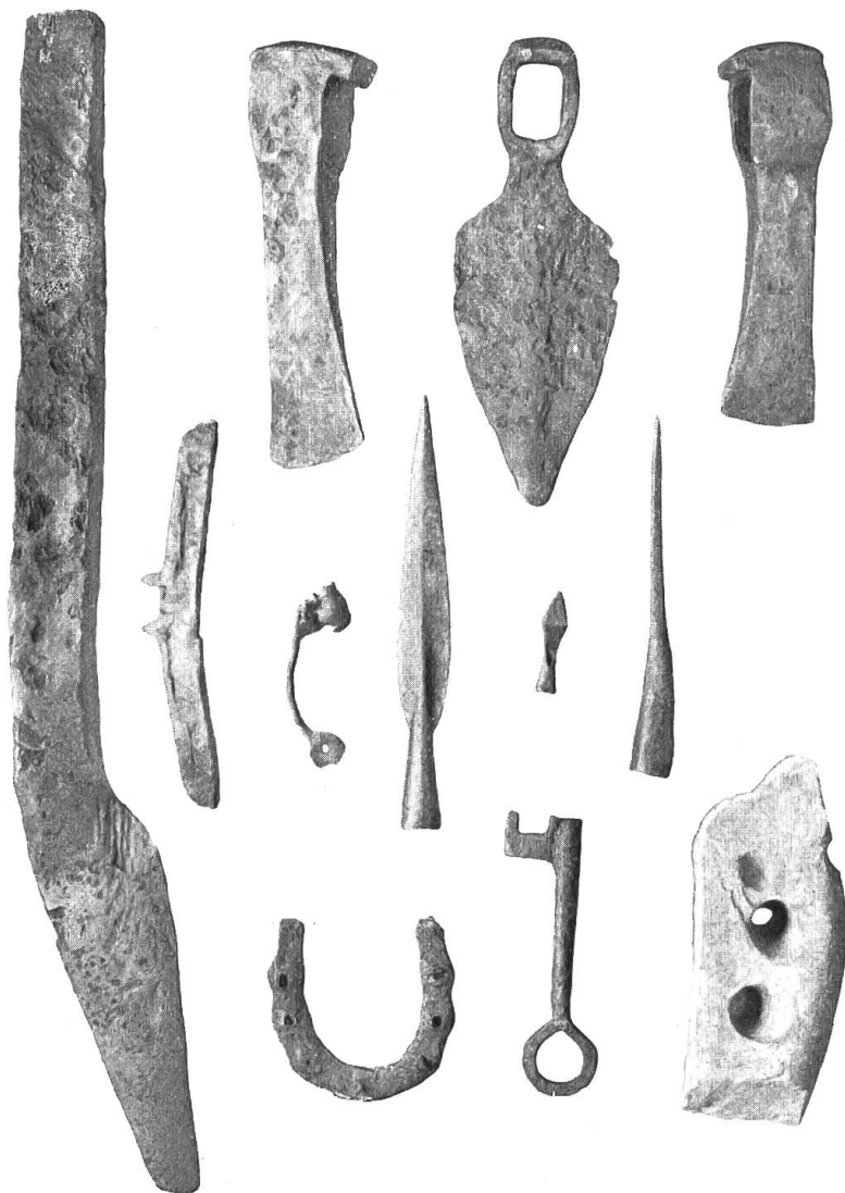
Funde von Erlenbach.

Erlenbach (Amt Niedersimmental). Auf dem sog. Pfrundhubel bei Erlenbach, westwärts von der Kirche (Top. Atl. Nr. 367, 115 mm