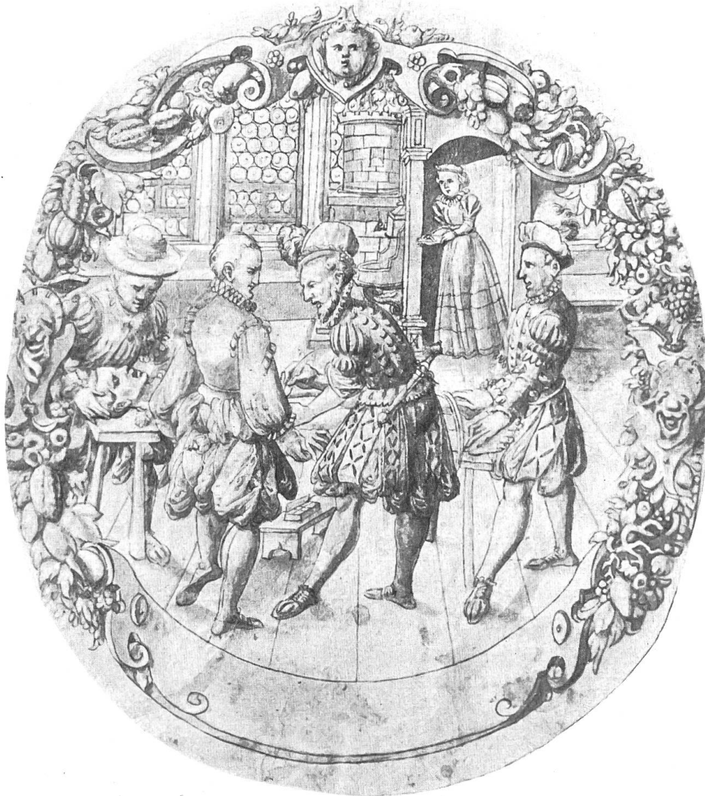
Scheibenriss mit Darstellung einer Operation. 16. Jahrh. Ende.