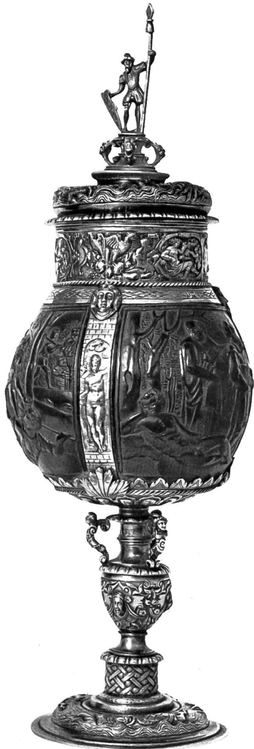
Geschnittene Kokosnuss in silbervergoldeter Fassung. Von Peter Strobel.