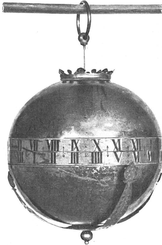
Kugeluhr von Abraham Ludwig Morant. Um 1700.

«Die Uhr stellt eine Kugel dar aus Bronze von circa 16 cm Durchmesser. Sie hat ein Gewicht von 3750 gr. In der Mitte der Kugel laufen 2 silberne Bänder, jedes mit den Zahlen I–XII. Von unten reichen kreuzweise 4 silberne breite Zeiger, 2 längere und 2 kürzere, zu den Zahlenbändern herauf; die längeren zu dem obern, die kürzeren zum untern Zahlenbände. Es bezweckt dies, dass man, wenn die Kugel in der Mitte eines Zimmers aufgehängt ist, von allen Seiten die Zeit ablesen kann. Die beiden Kugelhälften gehen in der Mitte auseinander. Die Zeiger sind unten angeschraubt. Oben hängt die Uhr an einer fein gearbeiteten stählernen Kette mit Gliedern. Die obere Öffnung umgibt ein Krönlein von Silber. Innen ist das Werk in der untern Kugelhälfte auf einem Eisenrahmen festgeschraubt.