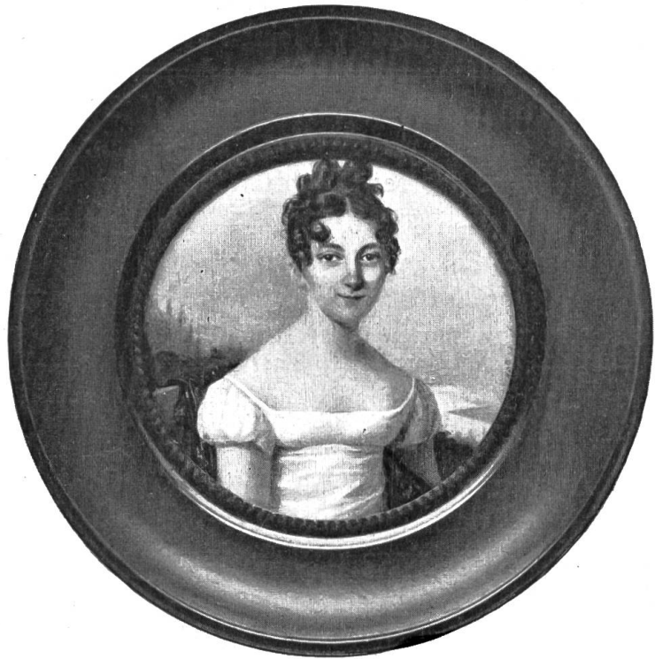
Grossfürstin Anna Feodorowna.