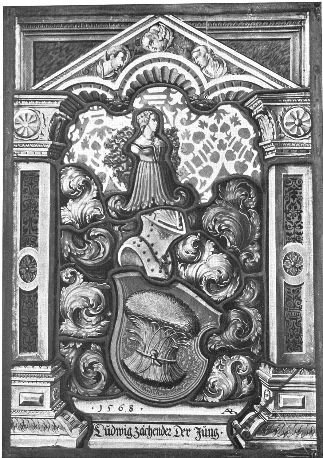
Ludwig Zehender. 1568. Von Abraham Bickart.