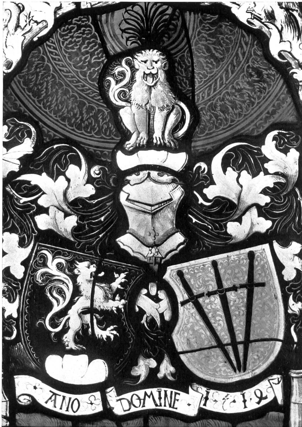
Wappenscheibe Freiburger=Michel. 1514.