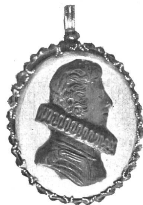
Anhänger. 16. Jahrh. Ende.