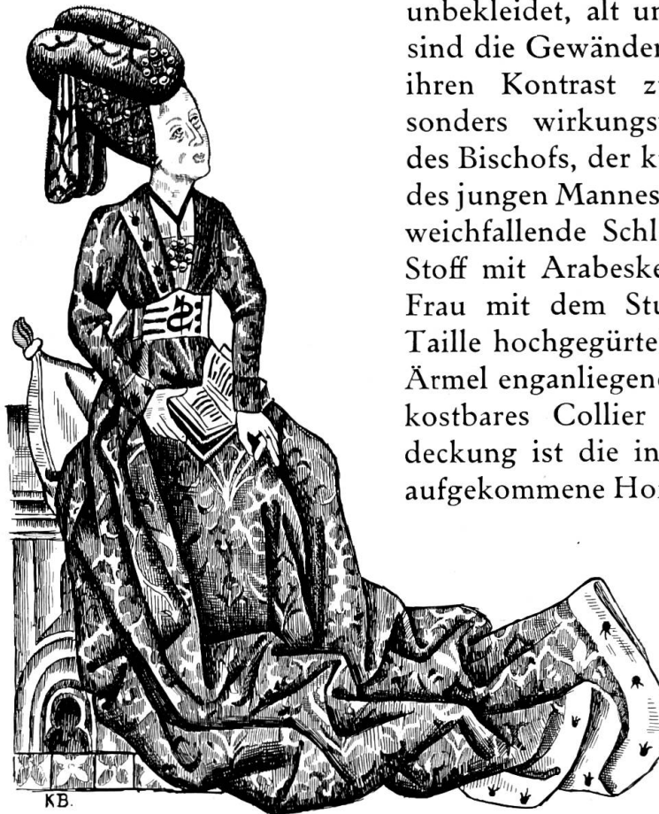
Fig. 3. Frau mit Stundenbuch auf dem Herkinbaldsteppich. 15. Jahrh. 2. Hälfte.

Der Trajans- und Herkinbaldsteppich, auf dessen Handlung wir hier nicht näher eintreten können — sie ist auf der Etiquette des Teppichs aufgezeichnet — ist für die Kostümgeschichte besonders interessant durch die Vertreter der verschiedenen Stände. Im Bilde 1 und 2 sitzt Kaiser Trajan in seiner fürstlichen Rüstung auf prunkvoll geschmücktem Ross, begleitet von seinen Getreuen, welche burgundische Ritterrüstung und Hoftracht tragen, während wir an der Witwe, welche vor Trajan kniet, das einfache, anliegende Kleid sehen. Auf Bild 3 und 4 dominiert Papst Gregor der Grosse im kostbaren reichgemusterten Kirchenornat. In der zweiten Legende dieses Teppichs, die den adeligen Herkinbald zeigt,