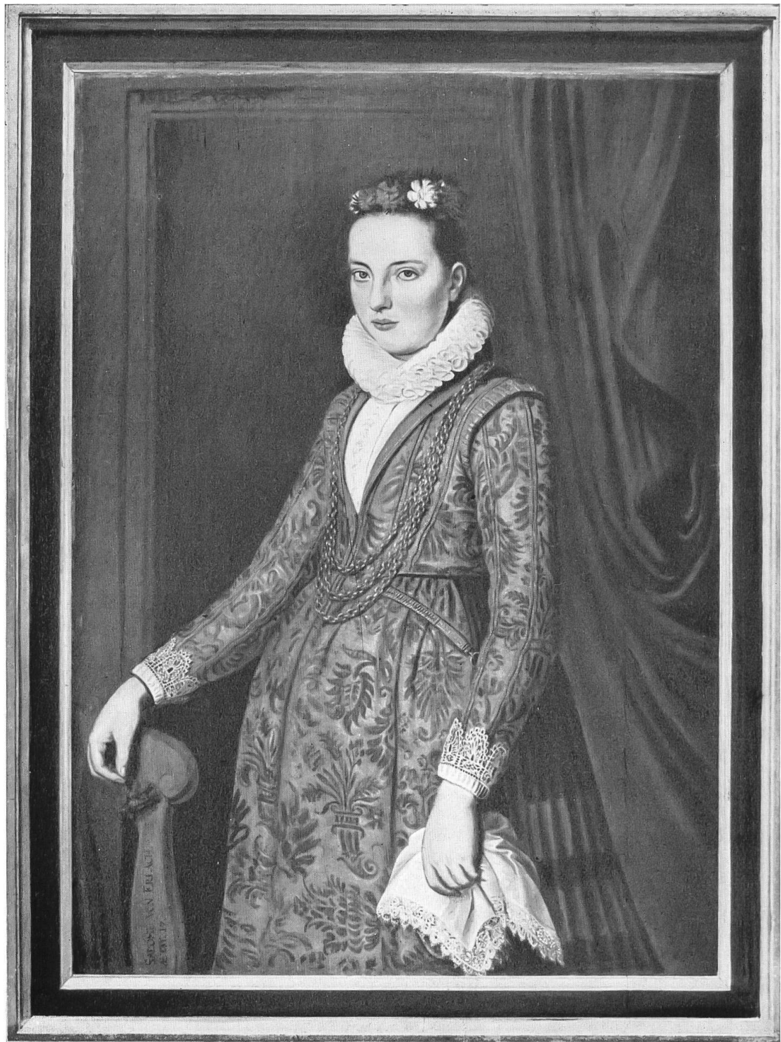
Salome v. Erlach. 1621. Von Bartholomaeus von Sarburg.