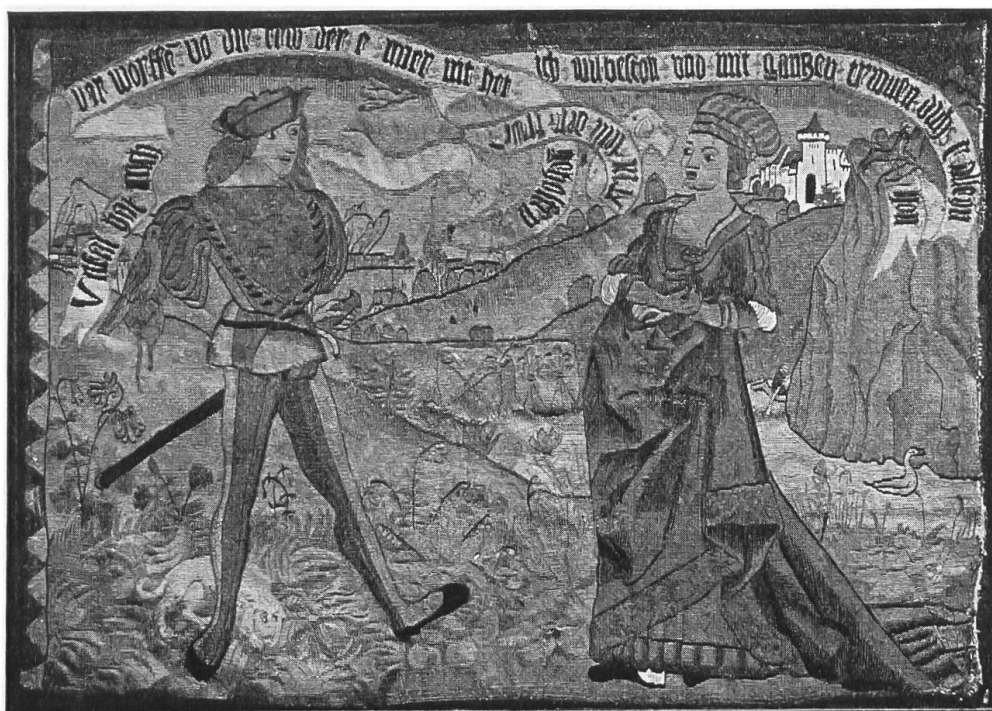
Fig. 4. Gewirkter Wandteppich mit Wappen Nägeli-Sumer. 15. Jahrh. Ende.

Ein Sofa, 3 Lehnstühle und 4 Sessel, in Kirschbaumholz geschnitzt, belegen mit ihrer geschweiften Form den Stil Louis XV, während ihre vornehm gestickten Überzüge mit ornamentaler Darstellung Louis XVI zugehören. Die Möbel stammen aus einem Landsitz in Gerzensee.