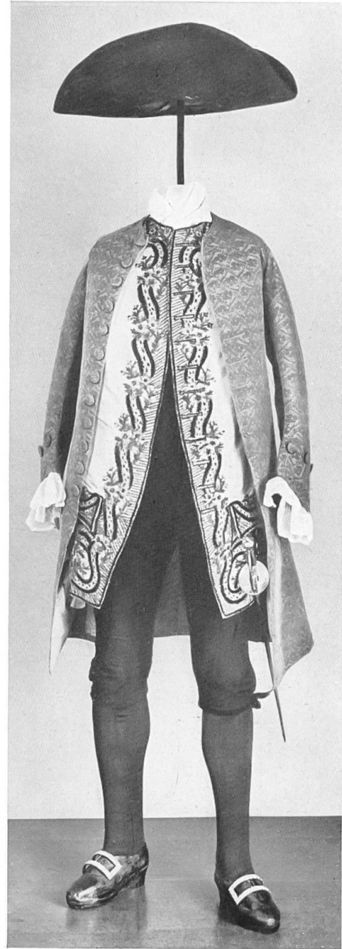
Galakleid eines Berner Patriziers. 18. Jahrh. Mitte.