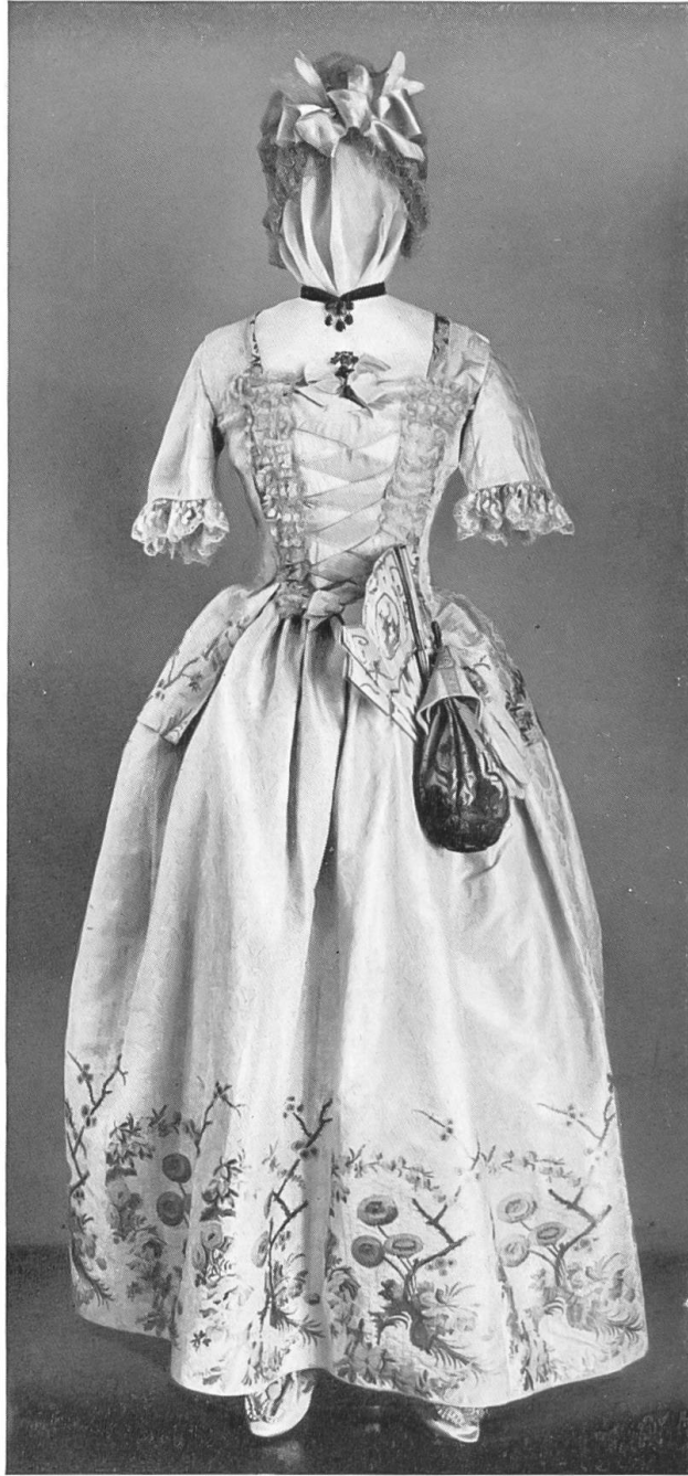
Gesellschaftskleid einer Berner Patrizierin. Um 1780.