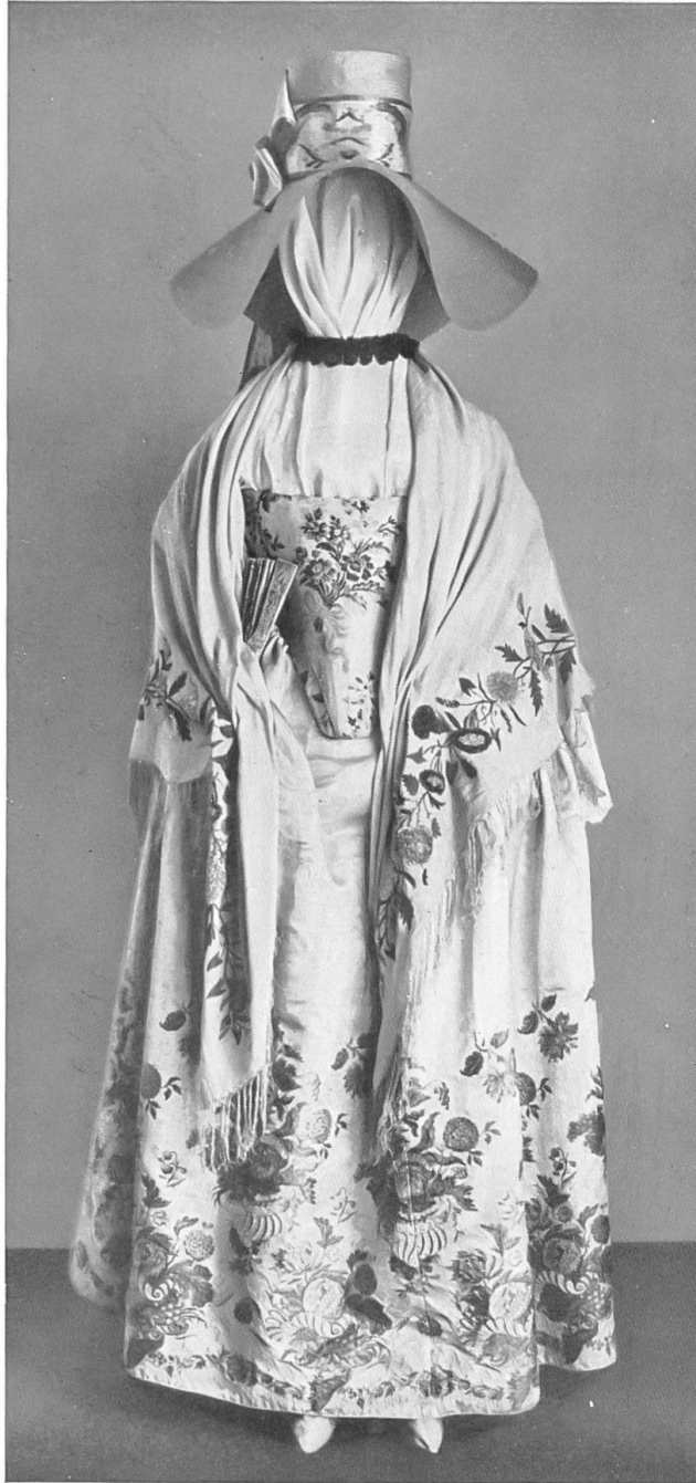
Gesellschaftskleid einer Berner Patrizierin. 18. Jahrh. Mitte.