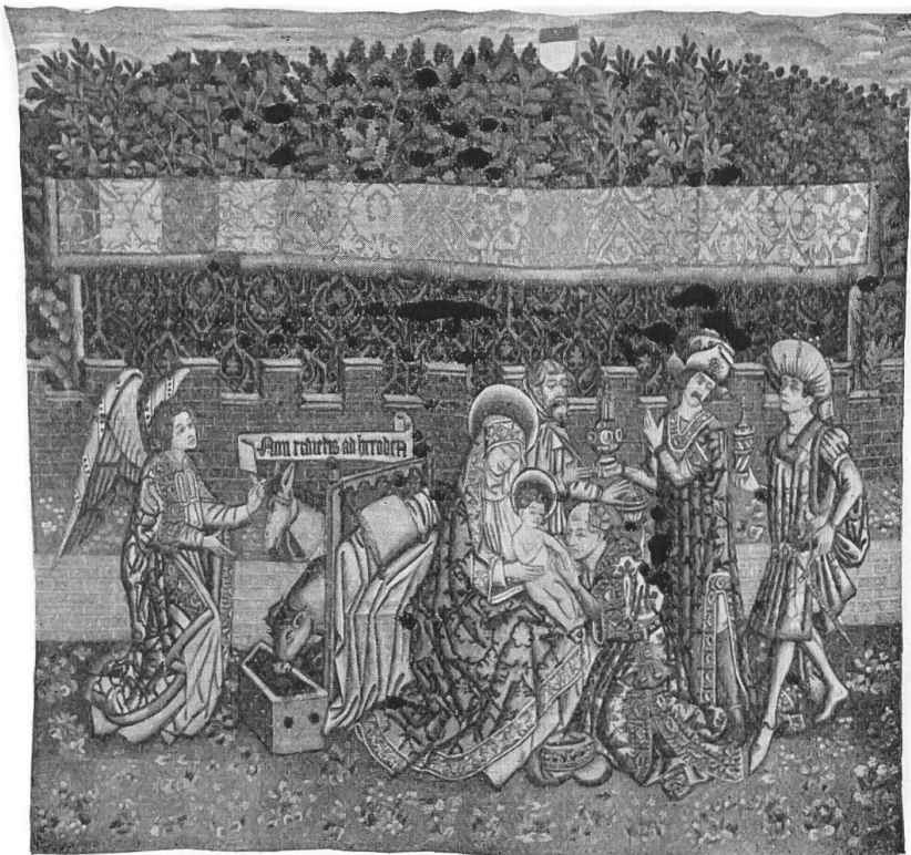
Fig. 2. Dreikönigenteppich. 15. Jahrh. Mitte.

Zunächst dem Dreikönigenteppich stehen aus der spätromanischen und der gotischen Zeit holzgeschnitzte Madonnen und Heiligenfiguren, in deren Gebärden und Gewand wir den Geist ihrer Zeit spüren und die innere Verwandtschaft mit dem grössten Kunstwerke der Gotik, dem himmelanstrebenden Dom.