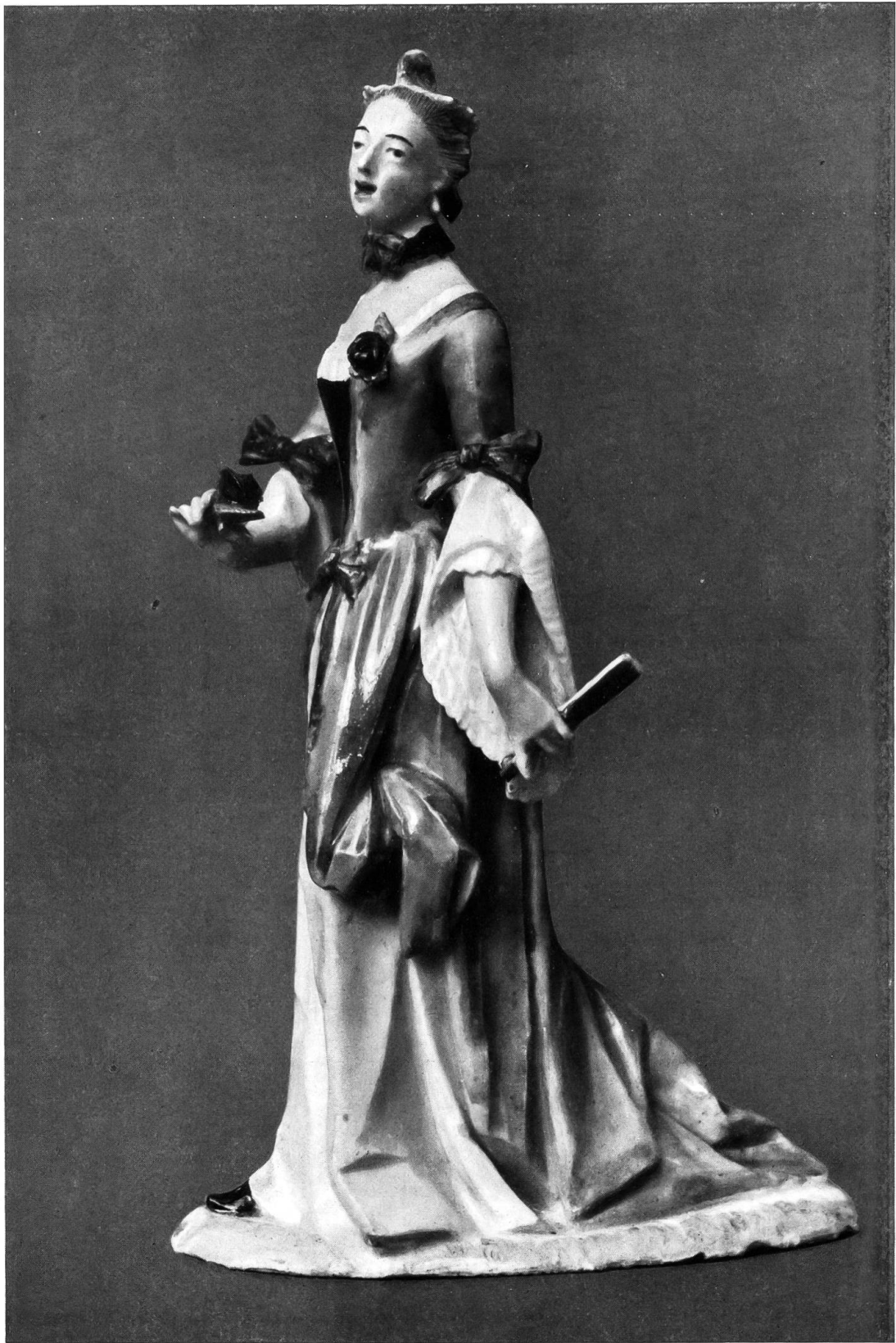
Taf. III. Nr. 27838. Neudeck-Nymphenburg. Schreitende Dame. Vor 1750.