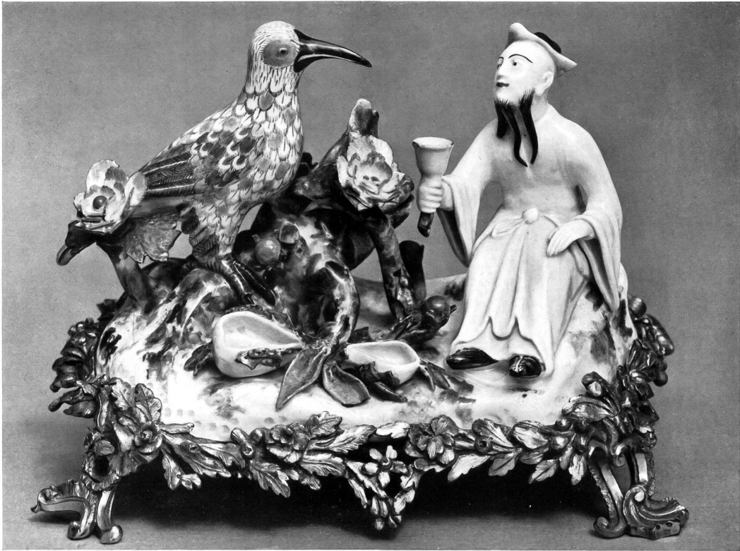
Taf. I. Nr. 28097. Meissen. Chinese und Vogel auf vergoldetem Messingsockel. 18. Jahrh.