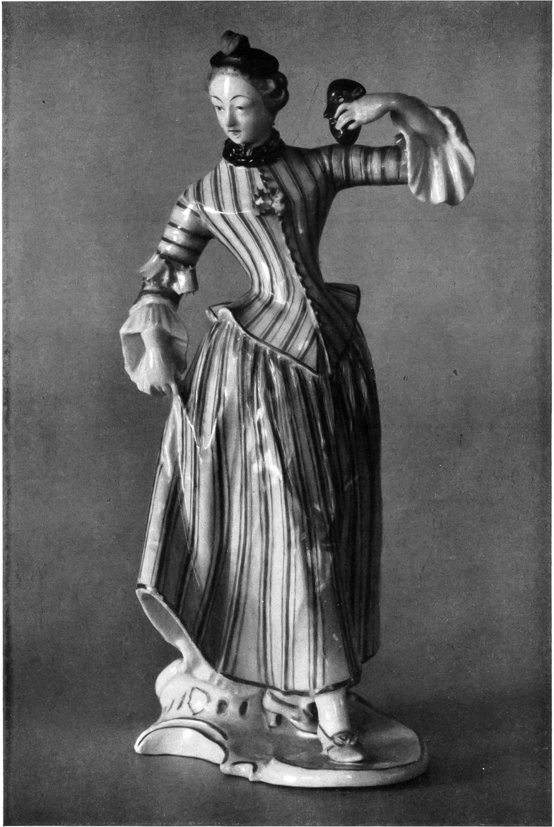
Taf. IV. Nr. 27848. Nymphenburg. Harlekine von Bustelli. 1754—1763.