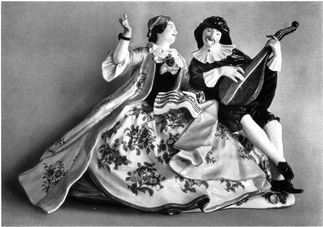
Taf. II. Nr. 27880. Meissen. Krinolinengruppe von Kändler. 1741–1743.