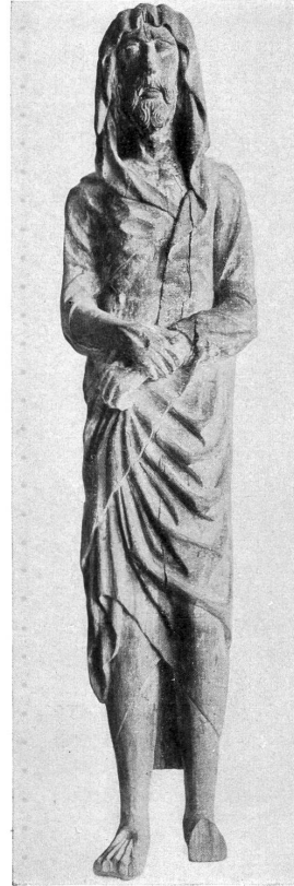
3. Aus Kerns. Zürich, Schweiz. Landesmuseum.