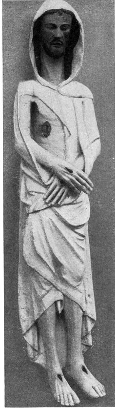
2. Vom Bürgenstock. Buochs, Sammlung Wyrsch.