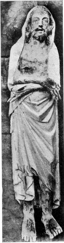
1. Freiburg. Kloster Magerau.