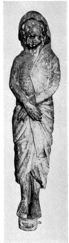
4. Aus Wollerau. Schwyz, Diöcesanmuseum.