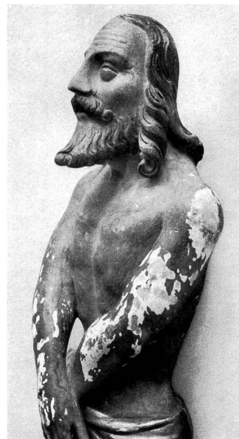
5, 6. Aus Engelberg. Bern, Hist. Museum, Inv.-Nr. 7873.